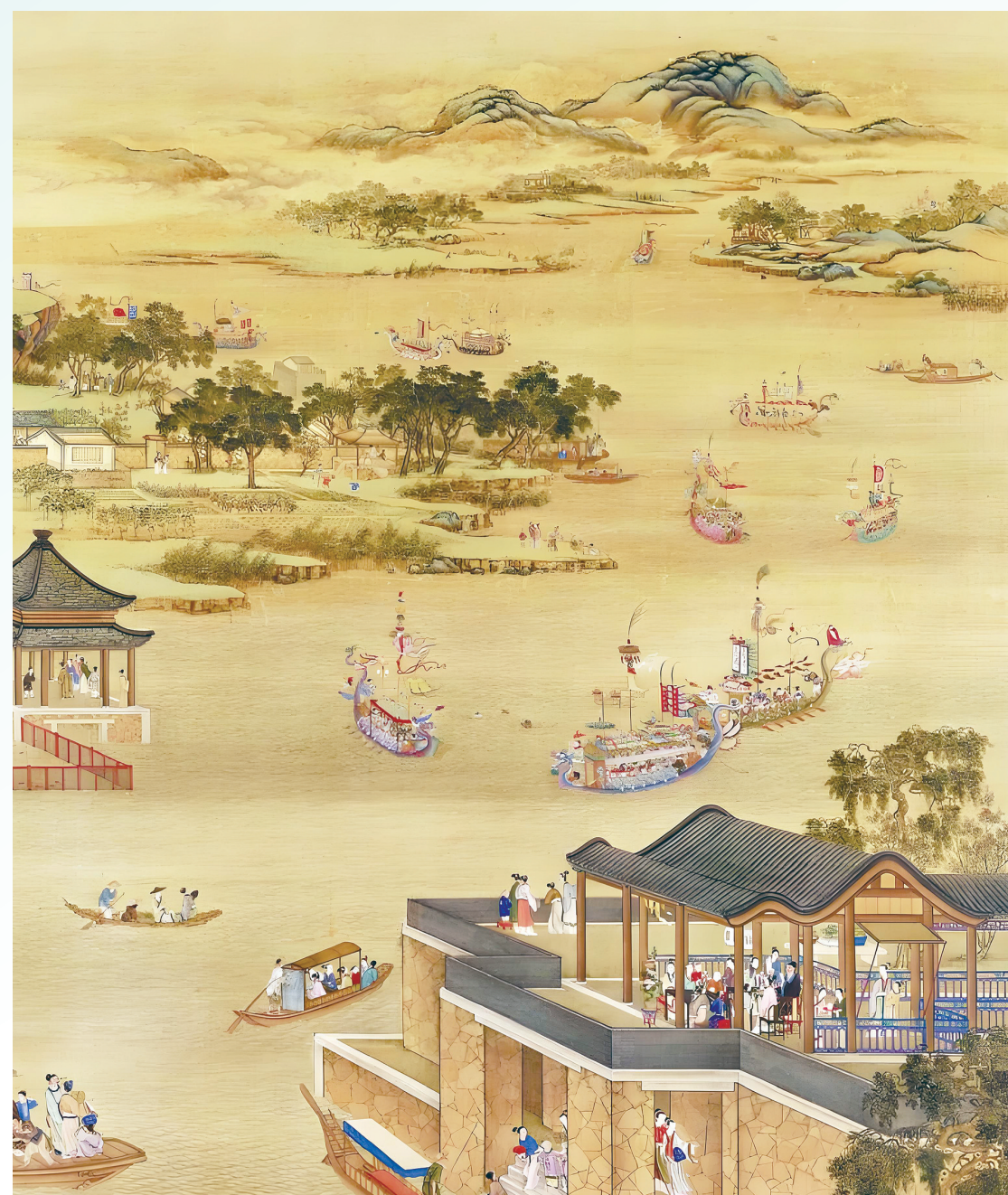
清(雍正十二月行乐图)之五月龙舟(局部)。