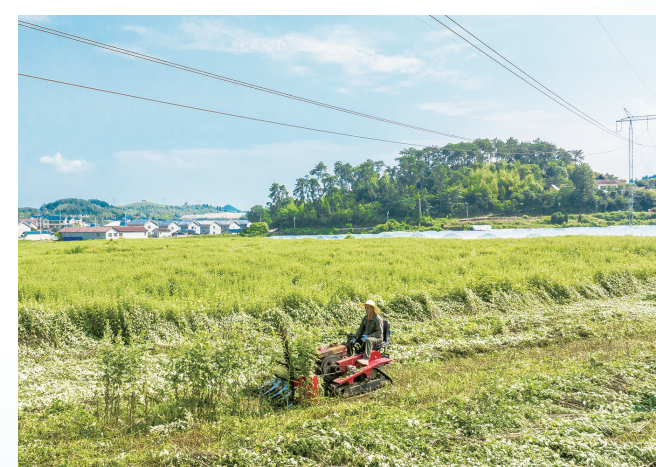
6月16日,中方县沙阳镇下坪村,村民在收割艾草。

食粽,是端午的标配。在民间,唐朝沈亚之有《五月五日》诗:“盘中粽解碧菰皮,楚俗相传吊屈祠。不独三闾沉水恨,万家从此煮香糜。” 在宣纸,唐玄宗家群臣用的九子粽:“穴枕通灵气,长丝续命人。四时花竞巧,九子粽争新。” 那软糯糯的粽子,在北方包进了红枣、蜜枣,在广东包进了蛋黄、绿豆,在川渝包进了麻辣腊肉,椒盐杂粮,在江浙包进了咸肉……引发了人们千年的粽子咸甜之争。 而在湖南,万物皆可粽,咸甜都入味。 在汨罗,自古以来,形状一定要包成牛角状,他们以牛角为祭品,以“三粒寸”糯米为食材,若泡过碱水,色泽金黄,“角黍包金”;若只泡清水,颜色洁白,称之“香蒲切玉”。 在道县,粽子要包成枕头状。稻草晒干烧灰,清水淋漓沉淀出灰水,不用脂膏不用肉,灰水粽散发着淡淡的稻草香。 在茶陵,人们就拿手的奥肉粽。选用肥瘦相间的五花肉,以茶水酿制的老冬酒文火慢熬而成。 在沅江,“芦笋芦菇肉粽”独一份。外用芦叶,内裹嫩鲜香的本地特产芦笋与芦菇,再加入腌制好的五花肉。 发展到今天,中国人的粽子,在时间上纵贯全年;在内容上无所不包。在闽南,包进了鲍鱼海鲜,在杭州,包进了龙井虾仁。而在湖南,新见的黄精粽、平江的辣条粽、湘潭的剁椒排骨粽风味独特。 在非经贸博览会2019年落户长沙,远销重洋的中国和非洲合作之路越来越宽,贸易额连续创新高。今年6月,中非经贸博览会又首次走进非洲本土摩洛哥。 在互联网岳麓峰会、世界计算大会、长沙国际工程机械展三大全国性行业峰会永久落地湖南,湖南敞开大门接纳全国产业链企业、外省龙头企业、行业协会入湘。 湘西山城怀化建起国际陆港,30小时可通达海,作为中国西部陆海新通道的重要节点,中欧班列、中老班列在这里集结,向西向东盟,向北到中亚和欧洲。 走向世界,走向未来。湖南正推进年轻人友好省份建设,澎湃更强劲的发展动能。