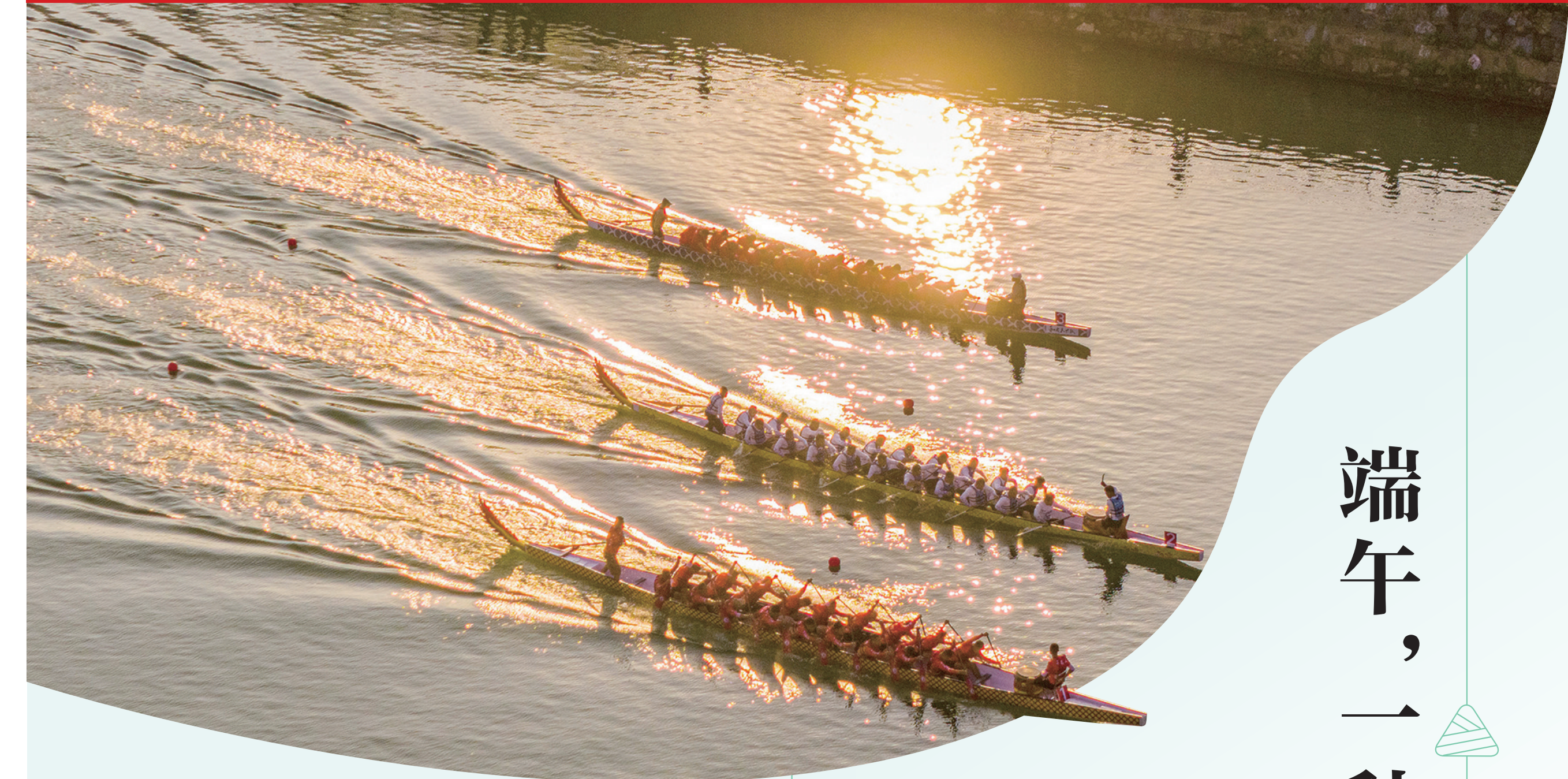
6月15日,双峰县梓门桥镇侧水河,娄底市梓门桥镇第三届龙舟文化节暨龙舟邀请赛火热举行。