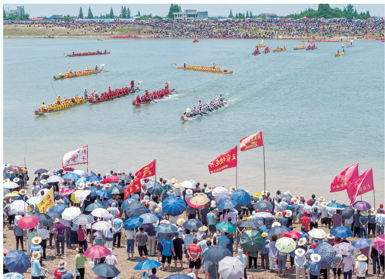
6月15日,湘阴县鹤龙湖镇一年一度的临资口民间龙舟赛火热登场,50多条龙舟抢滩竞速。

五月五,龙船下水打锣鼓。还未到端午,5月30日,2026麻阳传统龙舟邀请赛在锦江落幕,6月12日,道州龙舟赛在潇水开赛;6月14日,单船百人以上、的益阳兰溪双绕龙舟亮相马六甲,让马来西亚人“见证了水上版的“中国功夫””…… 划龙舟始于何时?宁波博物馆收藏的战国羽人竞渡纹铜钺,上方为龙纹,双龙昂首相向,前鼓弯曲,尾向内卷。下部以弧形边框线为舟,上坐四人成一排,四人皆头戴高高的羽毛冠,双手持桨似乎在奋力划船。这是有关划龙舟最早的图像之一。 而著名学者闻一多先生在《端午考》(端午的历史教育)里考证:在距今至少有四五千年前,住在江南的吴越民族,“断发文身”以“像龙子”,每年端午这天举行图腾祭——划着刻了龙纹的独木舟竞渡,把食物投进水里供奉龙神。这便是龙舟竞渡习俗的由来。 他们为什么选中端午这天呢?因为观天象,仲夏端午,东方苍龙七宿飞升于正南中央,处于全年最“中正”的位置。“飞龙在天”,这一天龙星升到最高,龙神离人间最近。 在湖南出土的《战国人物御龙帛画》表明,龙舟另有用途。帛画一男子头戴高冠,身穿博袍,腰佩长剑,侧立于龙舟,头顶有一华盖;龙昂首卷尾,弓身成舟,随风而行。舟尾立鹤(凤),舟旁有一鲤鱼随行。学者认为这是一幅“导引灵魂升天”图。 端午,在湖南的每一条江河上,都有龙舟在竞渡。看一次龙舟赛,能让你识得湖南人的真面目。 你去潇水看看道县人“宁完一年田,不输五月船”的龙舟赛,那千年传承的龙船,龙船头有龙、虎、麒麟4种类型,漆色达13种。湖南人不只吃得苦,也有巧心思。2024年,他们创下212条船同赛的吉尼斯世界纪录。 你去沅水看看“偷料”造的沅陵龙舟。无龙头,却敢横渡沅江,沅陵有全国少见的横渡过江赛制。当地的小孩还会不会跑,就在地上划旱龙舟了。湖南人不是孤勇者,都有童子功。 你去资水看看新化的龙舟赛,当年一只毛板船就敢闯出雪峰山的梅山后裔,稳稳掌控着龙舟,在大江南北“拿捏”10万家快印店。湖南人不只霸得蛮,也会生意经。 当然,今年的端午,你得去汨罗看“龙超”(湖南省龙舟超级联赛)总决赛。在举办过许多届汨罗江国际龙舟邀请赛的地方,来自乡野的38支劲旅争夺“龙王”。 一艘龙舟,一鼓号令,全体成员劈波斩浪,争分夺秒,冲向终点。那些怒吼的身影,让你看见最真象的“逆流而上”“风雨与共”“同舟共济”“众志成城”。 在这里,你恍然大悟:几千年来,世界上最高信“集体力量”的民族,就是这样靠着团结的力量,闯过一个又一个激流险滩。