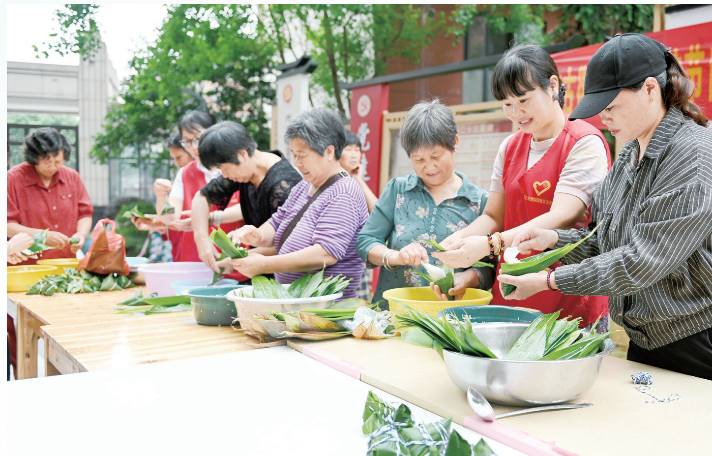
6月18日,洞口县花吉街雪梨园社区,居民在包粽子。

在端午的起源说里,有“伍子胥说”和“曹娥说”。一个是春秋末期楚国贵族、吴国忠臣被赐死投江,一个是东汉孝女投江寻父,同死于五月五这天。 但直至公元前278年,屈原在汨罗江怀石自沉,端午才真正从“毒月恶日”的防疫日和龙图腾的祭祀日,变成一个偶像的纪念日。 这一切的初始,源于汨罗人对放逐至此的三闾大夫的情义。传说当地人看到屈原投江,划起扁舟分秒去救他,于是有了龙舟竞渡的习俗;怕他被鱼虾咬,投饭团入水,于是有了粽子。直至五月十五,屈原投江的噩耗才传到汨浦,于是汨浦人把这天定为大端午来纪念他。 南朝梁代吴均所著的《续齐谐记》里记载:“屈原五月五日自投汨罗而死,楚人哀之,每至此日,辄以竹筒贮米,投水祭之。” 唐朝文秀以《端午》诗为证:“节分端午自谁言,万古传闻为屈原。堪笑楚江空渺渺,不能洗得直臣冤。” 中国人选择了屈原,端午是否起源于屈原已无关紧要,重要的是,从此,汨罗江成了蓝墨水上游,屈原成了端午的主角,也成了湘湖文化的源头。 屈原成了一代代人的精神偶像,他“举世皆浊我独清,众人皆醉我独醒”的高洁清刚,“长太息以掩涕兮,哀民生之多艰”的民本情怀,“路漫漫其修远兮,吾将上下而求索”的执着,激励了一批超级铁粉。 汨罗江畔,比他小140岁的贾谊,比他小195岁的司马迁,比他小1052岁的杜甫都来凭吊过他。 后世常以“贾谊”并列的贾谊,写下《吊屈原赋》。他与屈原同样少年得志,同样遭妒被贬,同样忠君爱民。他的《过秦论》《治安策》《论积贮疏》证明他不只是文学家。 司马迁在他创作的中国第一部纪传体通史《史记》中,为屈原撰写了一章《屈原列传》。而鲁迅《史记》为“无韵之离骚,史家之绝唱”。 一生忧国忧民的杜甫同样魂归汨罗江,当年,他吟诵“山鬼迷春竹,湘娥倚暮花”等向屈原致敬的诗句来湘。他死后,宋人把他和屈原共称:“远移工部死,来伴大夫魂。流落同千古,风骚共一源。” 当年,屈原在长诗《天问》里向天发了170问,千年后,在偏僻的永州,柳宗元以《天对》作答。 刘禹锡在常德待10年,“无论政治抱负,还是为人文,都以屈原为榜样”。“莫道谗言如浪深,莫言迁客似沙沉。千淘万漉虽辛苦,吹尽狂沙始到金。” 去宗棠以生在屈原之乡而自豪,毛泽东把《离骚》置于案头,列入终身最爱读的书籍之一…… 屈原、贾谊、杜甫、刘禹锡、柳宗元、去宗棠、毛泽东……他们构建了“心忧天下”的湖湘精神。 端午,一个令人恐惧的日子,因为屈原,从此有了浪漫和诗意,有了怀念偶像的连续情感。