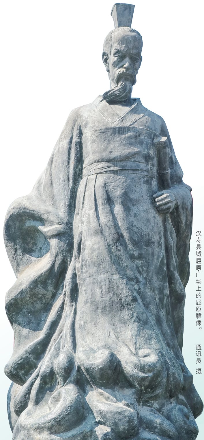
汉寿县屈原广场上的屈原雕像