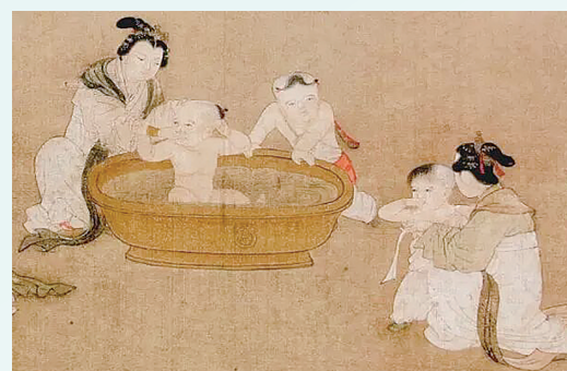
南宋(浴婴图)(局部)中描绘端午节为孩子进行芳香药浴的场景。