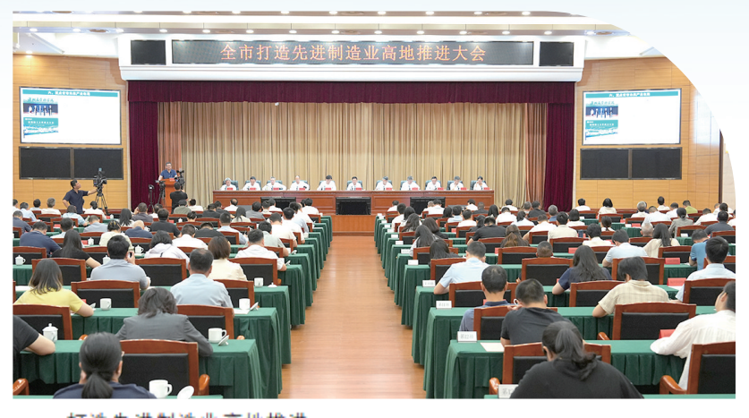
打造先进制造业高地推进大会会场。

此次大会新授牌的六大省级集群，被分为两类：四大先进制造业集群（音视频装备、新能源汽车、北斗、生物医药）瞄准战略性新兴产业赛道；两大县域特色集群（宁乡智能家电、望城特殊食品）深耕本地资源。这个结构隐藏着一条产业演进路径。