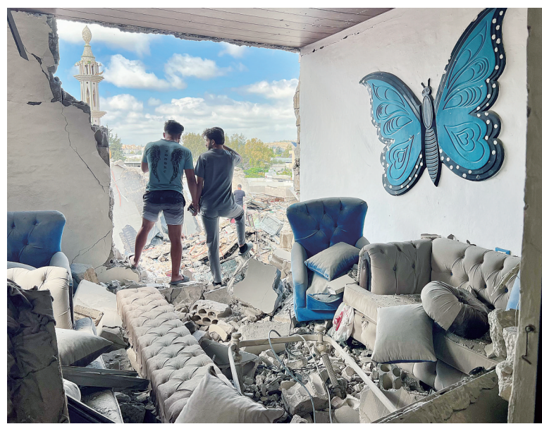
以色列国防军5月27日说,以军在过去一天袭击了黎巴嫩南部提尔、奈拜提耶地区以及贝卡谷地的150多个黎真主党基础设施和武装人员目标。图为26日,在黎巴嫩南部提尔市,民众查看受以军空袭被毁的房屋。

担任主席,成员包括内阁官房长官、外务大臣、防卫大臣等多名阁僚。“国家情报局”则被赋予对各政府部门情报工作的综合协调权。高市政府强化情报工作的举措持续引发担忧。一些日本民众近日在东京多次举行集会,对“国家情报会议”设立法案表示抗议。日本军事记者、前航空自卫官小西诚向新华社记者表示,日本政府推动构建新情报体系的目的之一,是压制那些反战和呼吁和平的声音。