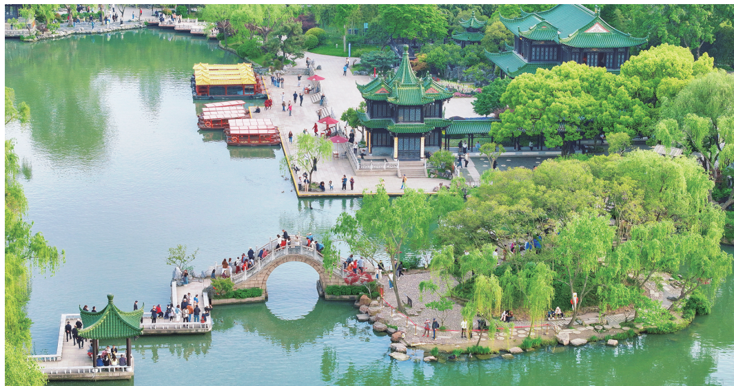
4月24日，江苏省扬州市，游客在瘦西湖二十四桥景点休闲游玩。

运河通达南北，各地乐班、艺人随船聚集，南音北曲在此交汇。清代《扬州画舫录》记载：船上常设乐部，吹笛、弹箫、十番锣鼓，月夜连宵不断。杜牧笔下的“玉人”，原指当时在扬州城从事歌舞表演的妙龄女乐人。而江峰青化用此典时，却不落“歌女”或“美人”的窠臼，只用了更宽泛的“有人”——他们或许是城中以乐艺谋生的职业乐人，或许只是寻常市民中那些真正喜欢音乐的人。 “人，是一座城市的主体。”柏红秀感叹，“扬州人以及他们的艺术生活，让这座城市拥有了一种极致的浪漫气息，令世人千年以来，心向往之。”