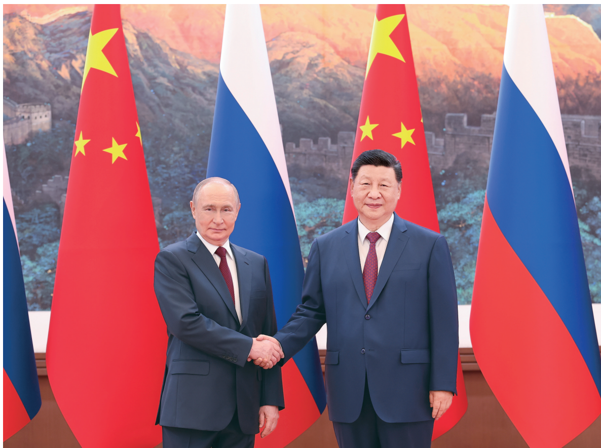
5月20日上午,国家主席习近平在北京人民大会堂同来华进行国事访问的俄罗斯总统普京举行会谈。