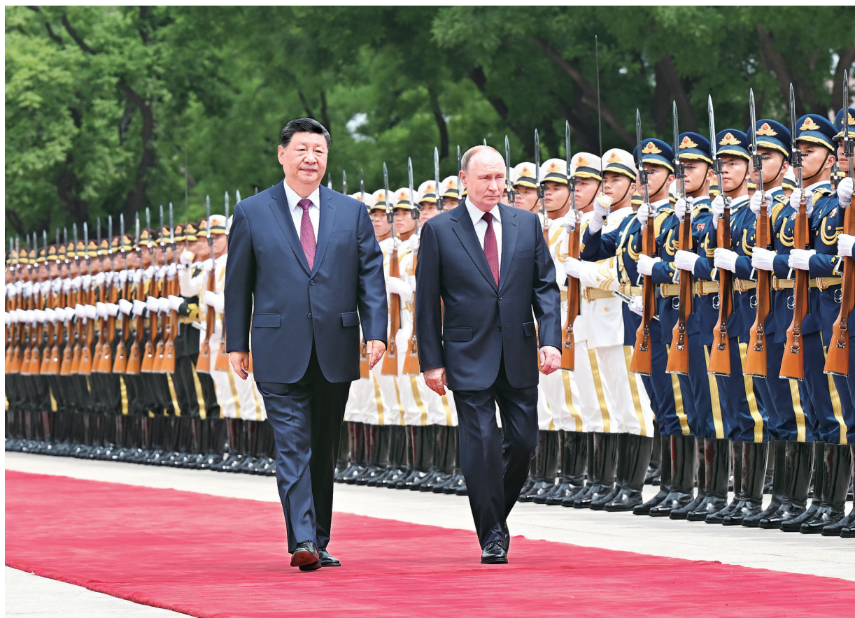
5月20日上午,国家主席习近平在北京人民大会堂同来华进行国事访问的俄罗斯总统普京举行会谈。会谈前,习近平在人民大会堂东门外广场为普京举行欢迎仪式。