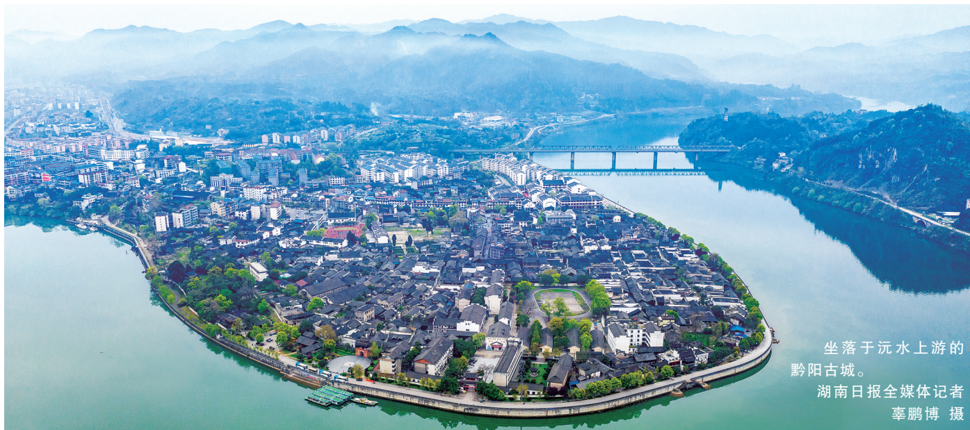
坐落于沅水上游的黔阳古城。