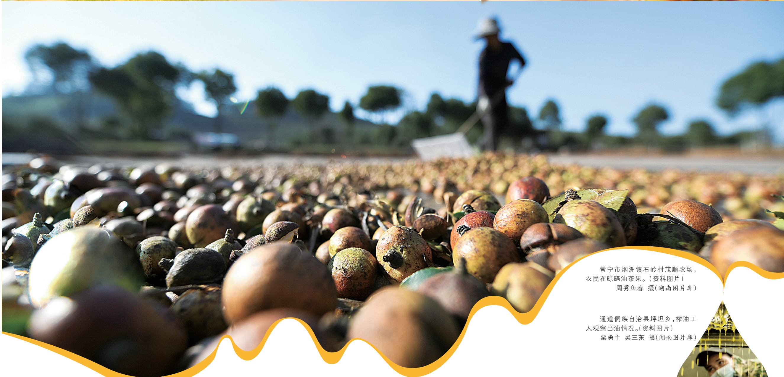
常宁市烟洲镇石岭村茂顺农场，农民在晾晒油茶果。(资料图片) 周秀鱼春 摄(湖南图片库)