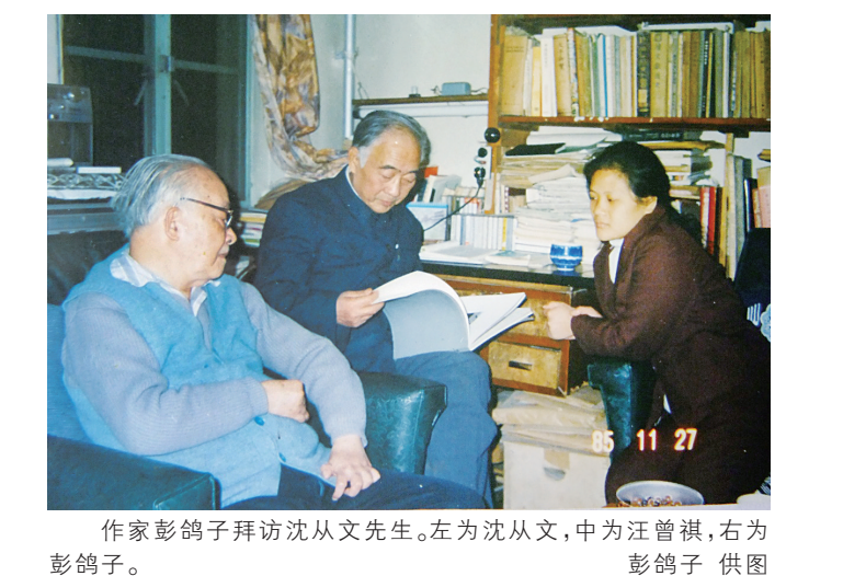
作家彭鸽子拜访沈从文先生。左为沈从文，中为汪曾祺，右为彭鸽子。

针对明查暗访发现的典型案例将依法查处、追责问责、公开曝光。各地区也将结合实际，同步组织开展针对性安全生产明查暗访工作。