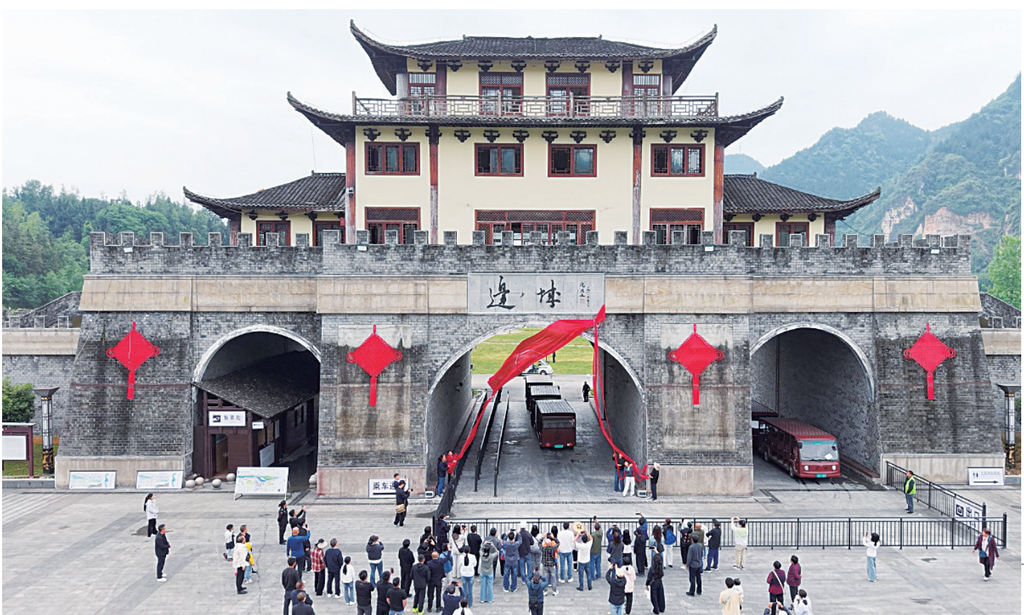
“边城”题字揭牌现场。

如今最为醒目的是拉拉渡码头崖壁上——“边城 沈从文”五个红色大字。这是1993年湘西籍书法家龙清廉潜心摹沈老笔迹所题。