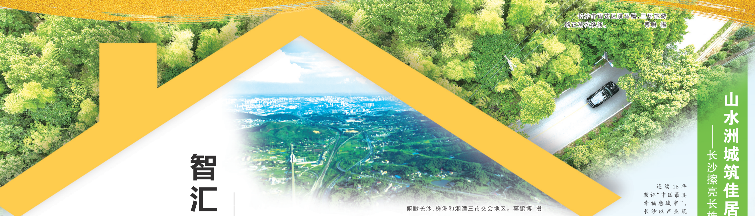
长沙市雨花区跳马镇，三环旅游路正焕新。