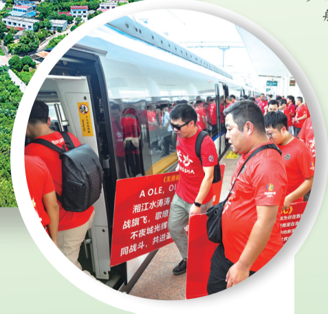
2025年湘超联赛期间，长株潭城铁为球迷首开专列。