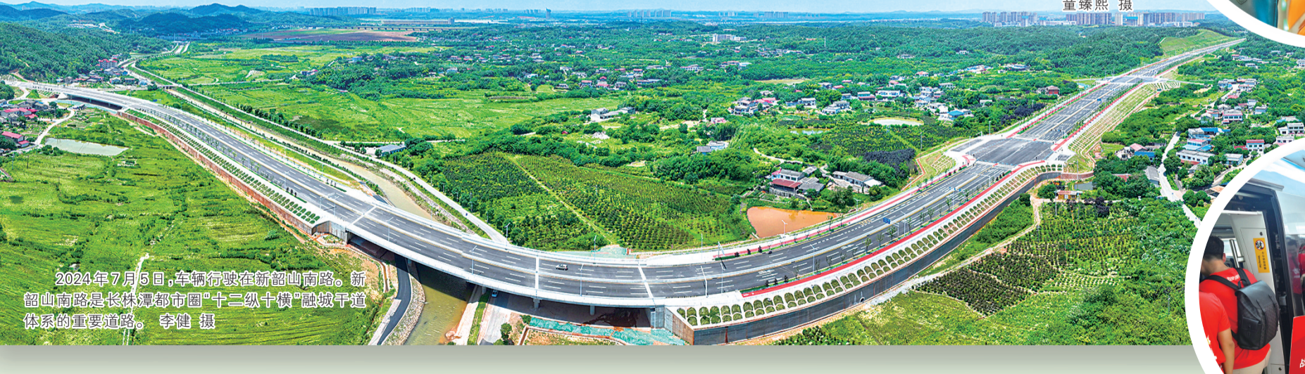
2024年7月5日，车辆行驶在新韶山南路。新韶山南路是长株潭都市圈“十二纵十横”融城干道体系的重要道路。

机遇叠加，东风劲吹。当前，长株潭发展正迎来历史性窗口期：生态绿心国家试点落地，529.79平方公里“城市绿肺”开启绿色转型新路径；要素市场化配置综合改革试点深入推进，7类28项改革举措激活发展动能；长江中游城市群纳入国家发展大局，第十六届全运会筹备提速，多重国家战略加持，让长株潭的战略地位持续提升，经济能级、城市品质、承载能力不断增强，为住房市场稳健发展、宜居建设提质升级提供了强劲支撑。2025年，长株潭经济总量达2.3万亿元，三市以全省约13%的国土面积创造全省41%的经济总量，核心引擎作用愈发凸显，成为吸引人口集聚、赋能安居发展的核心底气。