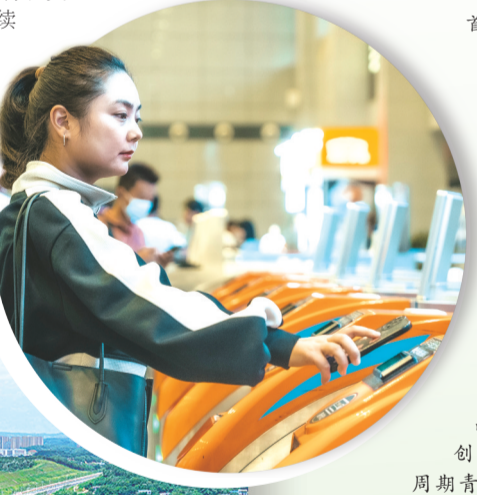
长株潭城际铁路长沙站，旅客在使用长沙地铁APP扫码进站。

以居为媒，广聚英才。借助长株潭都市圈“好房子”推介会东风，长沙以品质好房、稳健市场、暖心政策、优质配套，全方位展现宜居引才实力。未来，长沙将持续深耕品质人居建设，优化人才安居服务，不断厚植宜居优势、汇聚人才动能，书写城市高质量发展与人才安居乐业的双赢篇章。