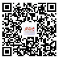
长按或扫二维码，百个楼盘优惠，一键领取