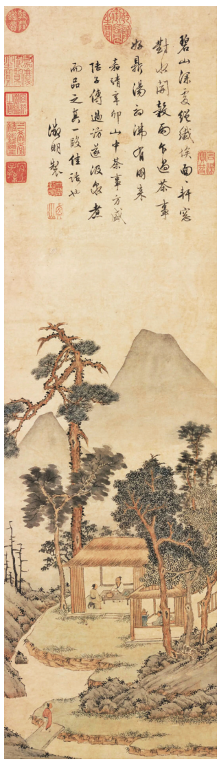
明代 文徵明《品茶图》88.3cm x 25.2cm 台北故宫博物院藏

与文徵明同龄的唐寅，自有品茶之道、谷雨之趣。也是谷雨时节，唐寅独自洗茶、煎煮、品饮，以体会春天勃勃的生命力。那巨石之下，枯木虬曲，古意丛生，唐寅跌坐在蒲团上，静待茶香溢出。四散的茶香与高峙的石块、挺立的新篁，形成孤傲自洁的意象，它们围绕在调茗者周遭，进而塑造了精神层面的唐寅。 闻过茶香，他以墨笔作《煎茶图》，自题七言诗曰：腥臙臙鼎原非器，曲几蒲团迥不尘。排过蜂衙窗日午，洗心闲试酪奴春。酪奴，语出《洛阳伽蓝记》，为茶茗之戏称。这一年的谷雨，唐寅没有扎进热闹的勾栏瓦舍，他观午后阳光，看蜜蜂飞过花丛，闲试酪奴春茶，独自洗心、静观。 相较唐寅的孤高，文徵明要温和许多，即使独自品茗，也可安然如初。1534年谷雨前两日，虎丘茶事方盛，文徵明身体抱恙，身不能至。佳友念之，差人送来新茶三两种，文徵明精神顿足，似是获得了良药，急忙汲泉水烹啜之。片刻时分，茶汤入口，他恍入仙境，作诗十首：花落春院幽，风轻禅室静……仙游恍在兹，悠然入灵境。 时至谷雨，学生居节未见文徵明前来虎丘盛会，遂登门拜访。在山中居所，居节临仿老师旧作《品茶图》以纪念，画作半日即成，他自知笔墨不足，称己画为貂尾之续。文徵明与居节望向窗外，泉声依旧汨汨作响，古松高耸依然。 至晚岁，文徵明的追随者颇多。少年陆师道在中得举人十年后，因母返乡，居家十四年，拜文徵明为师。画者陆治、文学家王穉登均从文徵明学画，持法不阿的吏部员外郎王谷祥，亦师从文徵明。 王谷祥可谓是文徵明的得意门生，老师曾数度赠他画作，以鼓励其继续向前。1551年，81岁的文徵明身心无恙，尚能短途登山。谷雨刚过，他收到学生王谷祥的诗作，细味诗意，展纸作画一幅，于卷后写道：白云江清水映霞，夕阳栏槛见天涯。白云悠悠，江水澄澈，倚着夕阳下的栏杆，便能望见天涯。 年迈的文徵明，心境愈发宽广，视线愈发辽远，怎奈可装下白云、清江与晚霞的温和画者，竟渐渐走到了人生的尽头。1559年，未到谷雨，文徵明安然离世。 约是十一个春秋，文徵明的侄子文伯仁，也近古稀。谷雨时节，69岁的文伯仁参叔父笔墨图式，再写《品茶图》。图中的古松、山势与溪水，弥漫着文徵明的余韵，近半个世纪前的谷雨新茶，依稀可嗅。 画作上端，文伯仁题写道：幽人纱帽笼头坐，曲径风花鬓髻飞。酒客未通尘梦醒，静看斜日照松扉。隐士静坐茶席，落花绕髻纷飞，酒醉的客人还未从尘世的梦