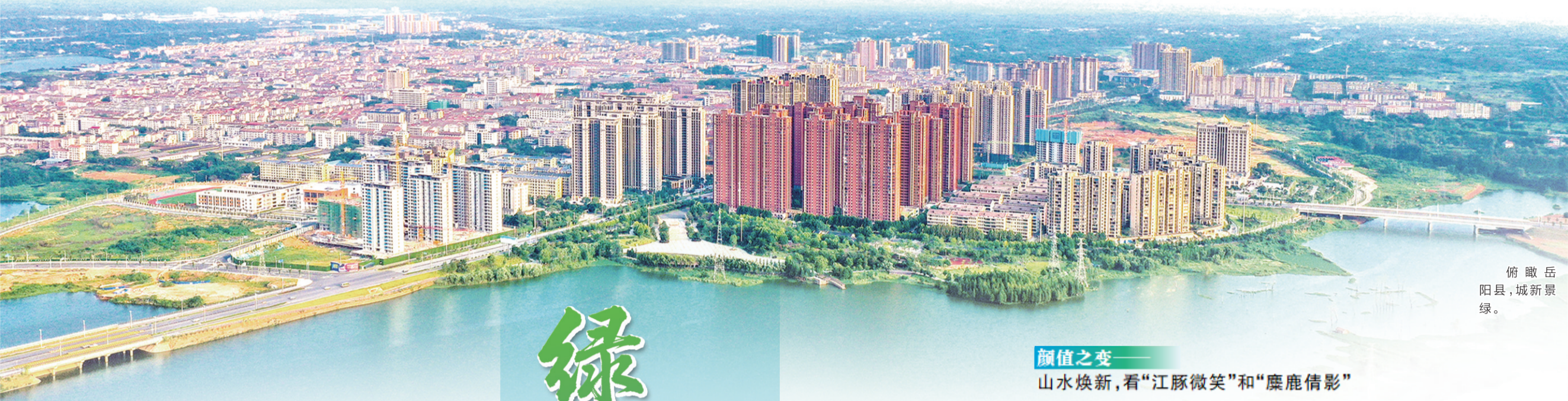
俯瞰岳阳县，城新景绿。