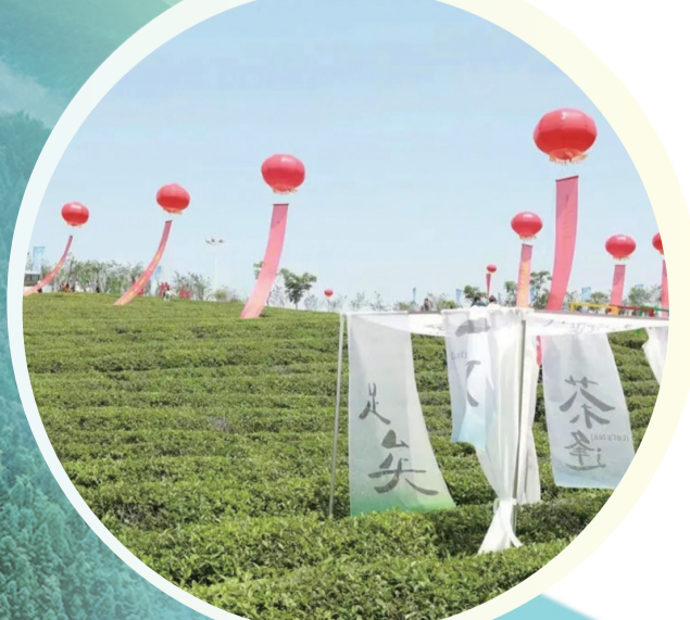
黄沙街茶场生机盎然。