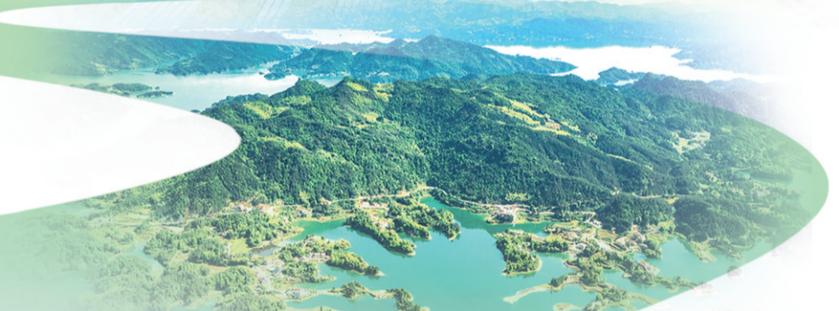
新墙镇清水村绿满沃野。