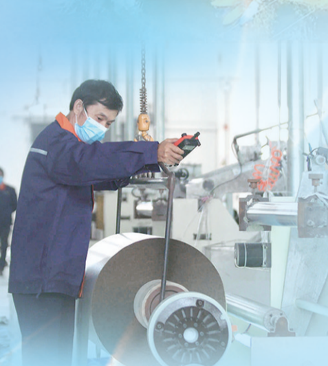
平江县兴科云母制品有限公司生产车间。