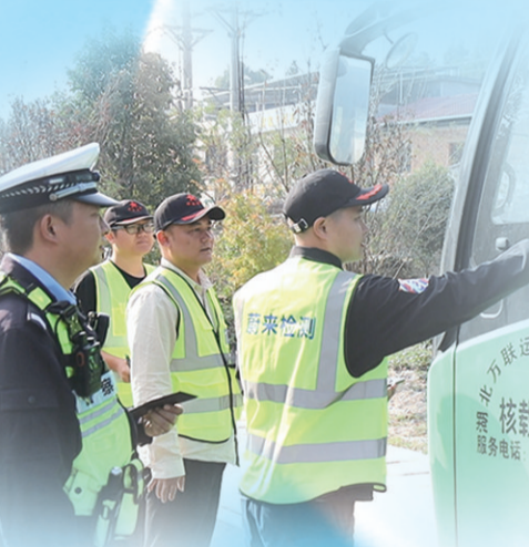
2024年，平江县、湖北省通城县、江西省修水县联合开展大气污染防治联防联控专项行动。