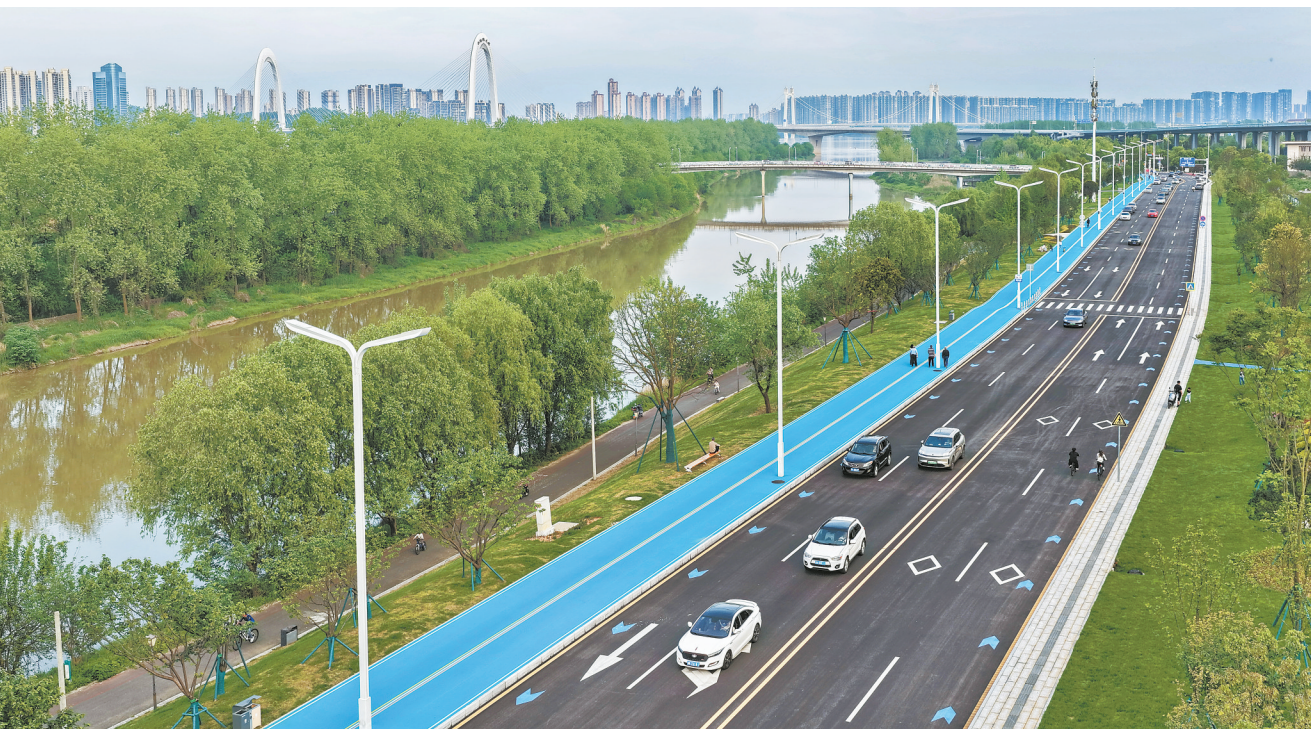
4月19日，长沙市望城区潇湘大道景观道正式通车。这条由望城集团倾力打造的滨江生态廊道，南起银星路，北至枫树港桥，全长13.66公里。该项目在提升防洪能力的同时优化了滨江景观，沿线多个观景平台成为市民欣赏风光的绝佳去处。