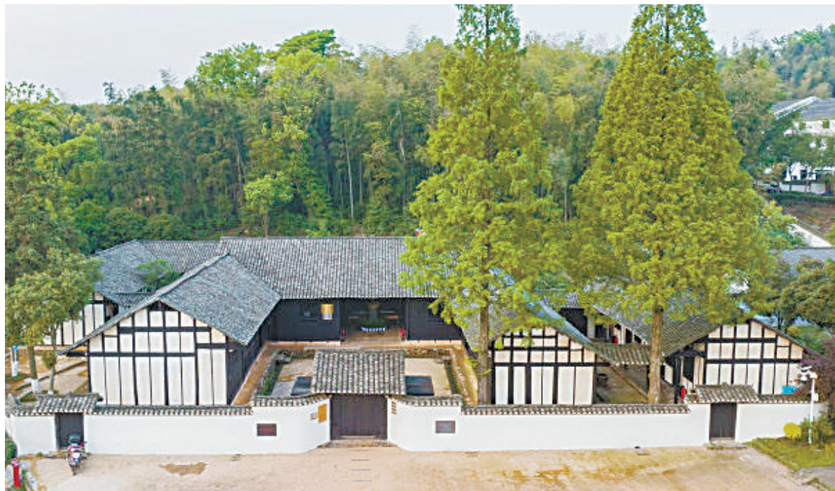
益阳市赫山区谢林港镇清溪村，周立波故居。