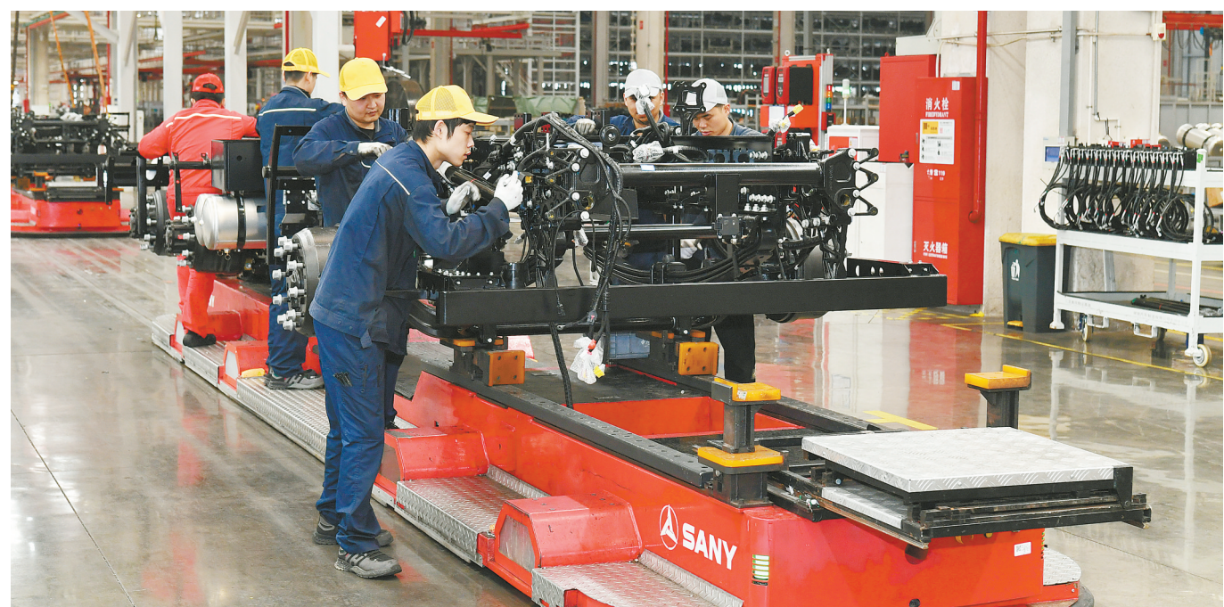
4月15日，长沙三一智联重卡产业园商用车智能制造车间，工人正在组装重卡部件。该产业园配置3个超级立体库、超700台AGV和224台机器人，实现了燃油重卡、电动重卡、氢能重卡等多车型柔性混线生产，通过全链条工业互联网赋能，信息化效率较传统工厂提升10倍。