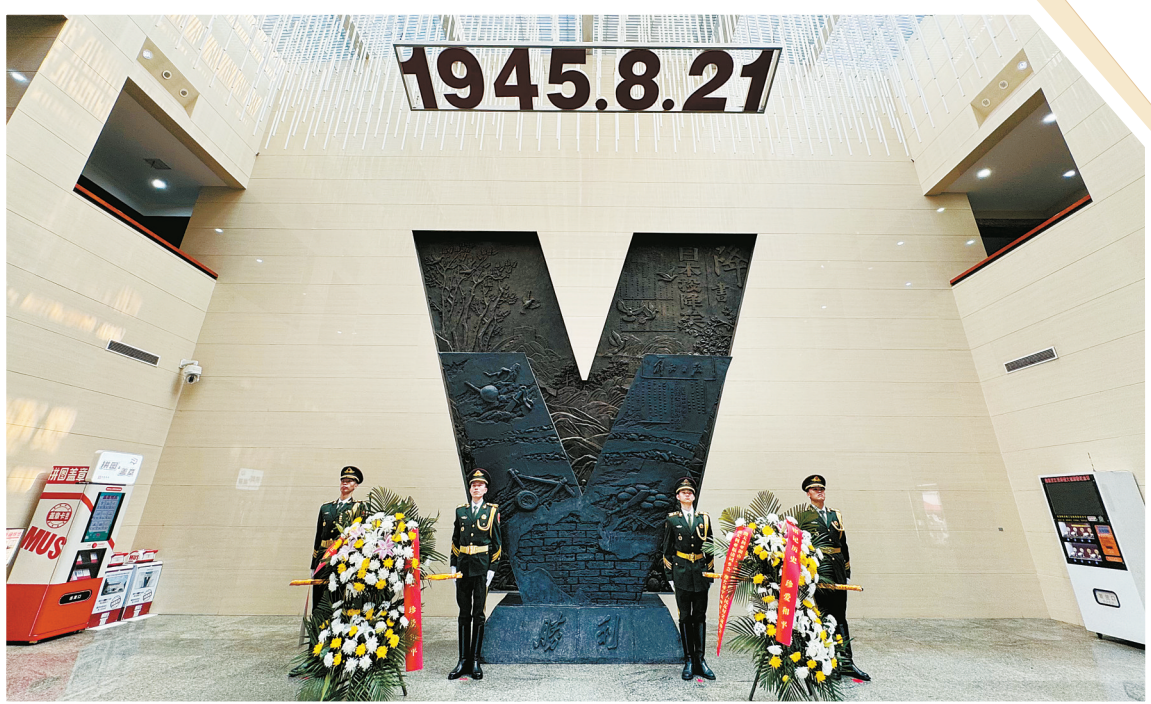
相关人员向胜利V雕塑敬献的鲜花。