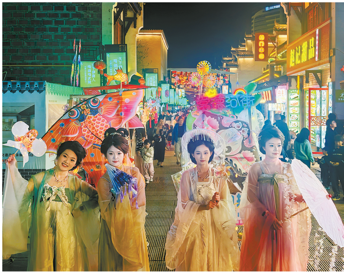
4月5日晚，常德河街流光溢彩，汉服爱好者在古街穿行。作为常德文旅名片，河街通过融合多元业态、打造沉浸式项目，成功聚拢人气，点亮夜间经济，成为推动当地文旅消费提质升级的新引擎。

边城茶峒景区在清明假期游人如织。游客体验独特“拉渡渡”，在“一足踏三省”碑打卡，品尝融合湘、黔、渝风味的菜肴，感受浓郁的本土生活气息。