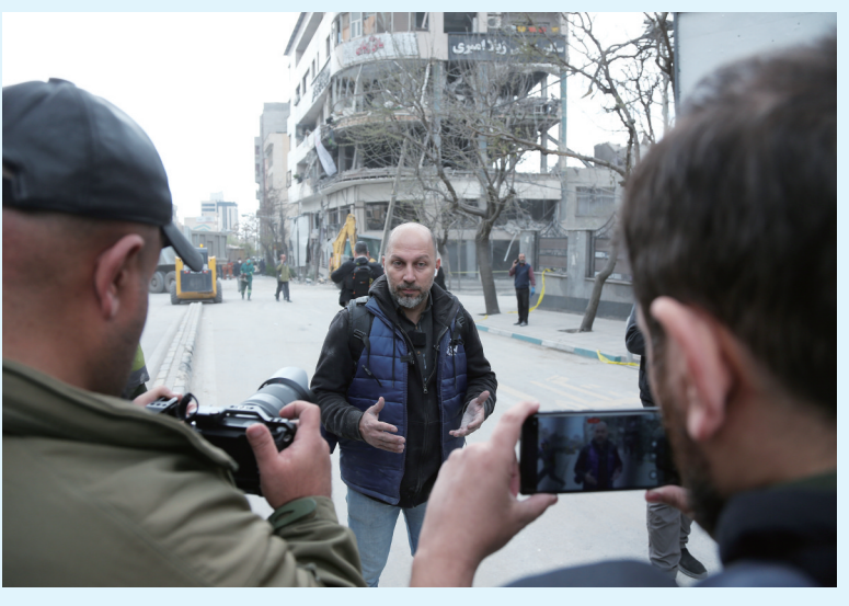
右图：3月29日，卡塔尔阿拉比电视台说该机驻伊朗首都德黑兰的办公室遭到军事袭击，图为卡塔尔阿拉比电视台的一名记者在德黑兰向媒体介绍情况。