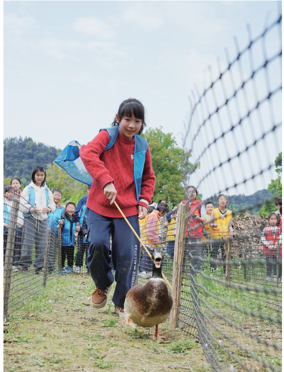
4月初，春假与清明小长假“牵手”，各地中小学生学习丰富多彩的活动，享受欢乐时光。图为3日，在重庆市北碚区歇马街道虎头村一农场，孩子们参加赶鸭子比赛。

融入全国统一大市场，是发展命题，更是改革命题。各地要以“咬定青山不放松”的韧劲，将国家所需、地方所能、市场所盼紧密结合，以深化改革开放破卡点、强联通、建枢纽、增动力，在融入和服务全国发展大局中实现更大发展，为中国号巨轮行稳致远提供有力支撑。（新华社北京4月4日电）