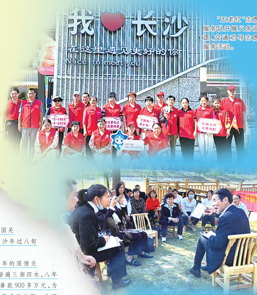
“五老红”志愿服务队开展义务巡逻、交通劝导志愿服务活动。

山海寻梦，不觉其远；前路迢迢，阔步而行。当前，长沙正紧扣“学思想、看变化、助发展”主题，引导广大老同志持续深化理论武装、感受时代脉动、贡献智慧力量。展望“十五五”新征程，深厚的“银发力量”，必将继续与奔腾向前的长沙同频共振，共同绘就中国式现代化长沙实践更加绚丽的篇章。