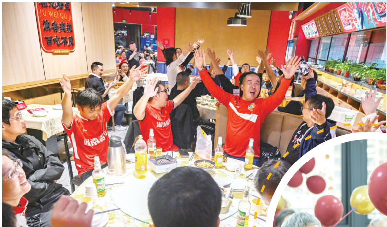
►2025年10月28日，娄底市康复养老中心开展重阳节敬老活动。工作人员精心设计趣味游戏，让老年人在欢声笑语中感受节日温暖，营造尊老爱老的浓厚氛围。

省人大代表，长沙市财政局党组书记、局长邹刚表示，2026年，长沙市财政局将持续深化零基预算改革，强化“贯通、协同、闭环”理念，提升财政管理科学性和风险防控有效性，集中财力保重点领域，防范化解财政运行风险，为奋力开创现代化长沙建设新局面提供有力保障。