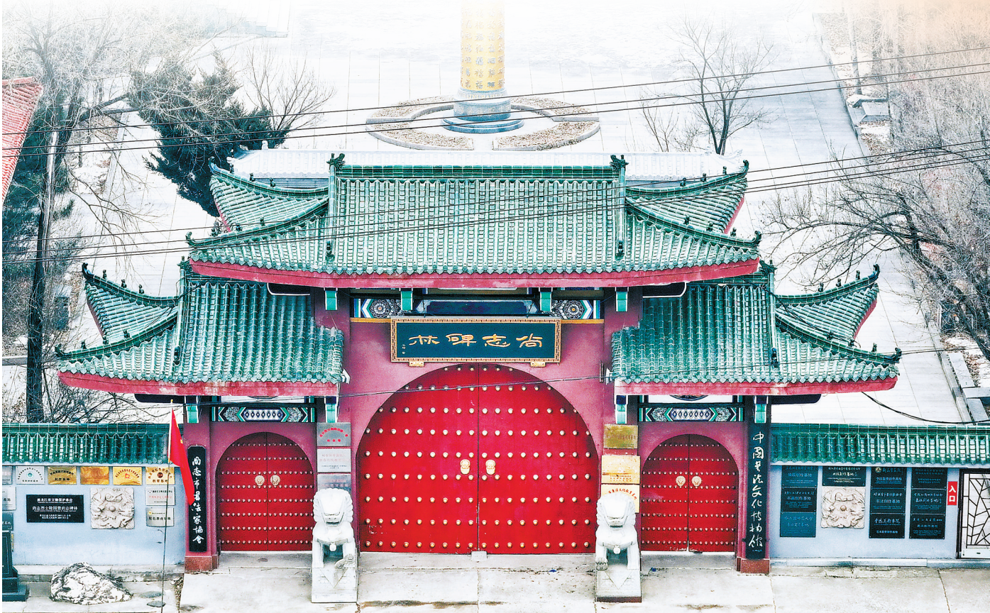
▲11月26日，黑龙江省哈尔滨市尚志市尚志碑林。