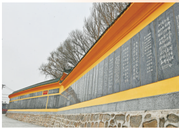
11月26日，尚志碑林一角。

当《松花江上》的旋律再次响起，它连接的不仅是历史，更是一脉相承的生命力。这生命力，蛰伏于每一寸黑土，涌动在今日每一个豪迈、热忱、坚韧的普通人身上，生生不息。