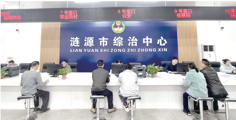
涟源市综治中心服务大厅。

4月22日，涟源市信访问题综合治理“大走访、大排查、大化解、大攻坚、大整治、大提升”专项行动部署会议召开。会议强调，信访工作对于巩固党的执政基础、维护社会和谐稳定、促进经济社会发展具有重要意义，要坚持关口前移、重心下移，强化源头预防和属地化解，真正把基层打造成化解矛盾、消除隐患的“第一道坚固防线”。 基层是社会治理的最末梢，也是矛盾纠纷的易发地。提升治理效能的关键在于推动工作重心、人员力量、资源要素向基层一线下沉，涟源以“六大专项行动”的实施为抓手，推动基层治理变被动应对为主动发现，化事后处置为事前预防。 涟源召开市乡村三级干部大会专题部署信访综合治理“六大专项行动”，建立乡村干部联户包片驻村机制，推动信访工作重心下移、关口前移，畅通民意“高速路”。目前，全市走访群众29万