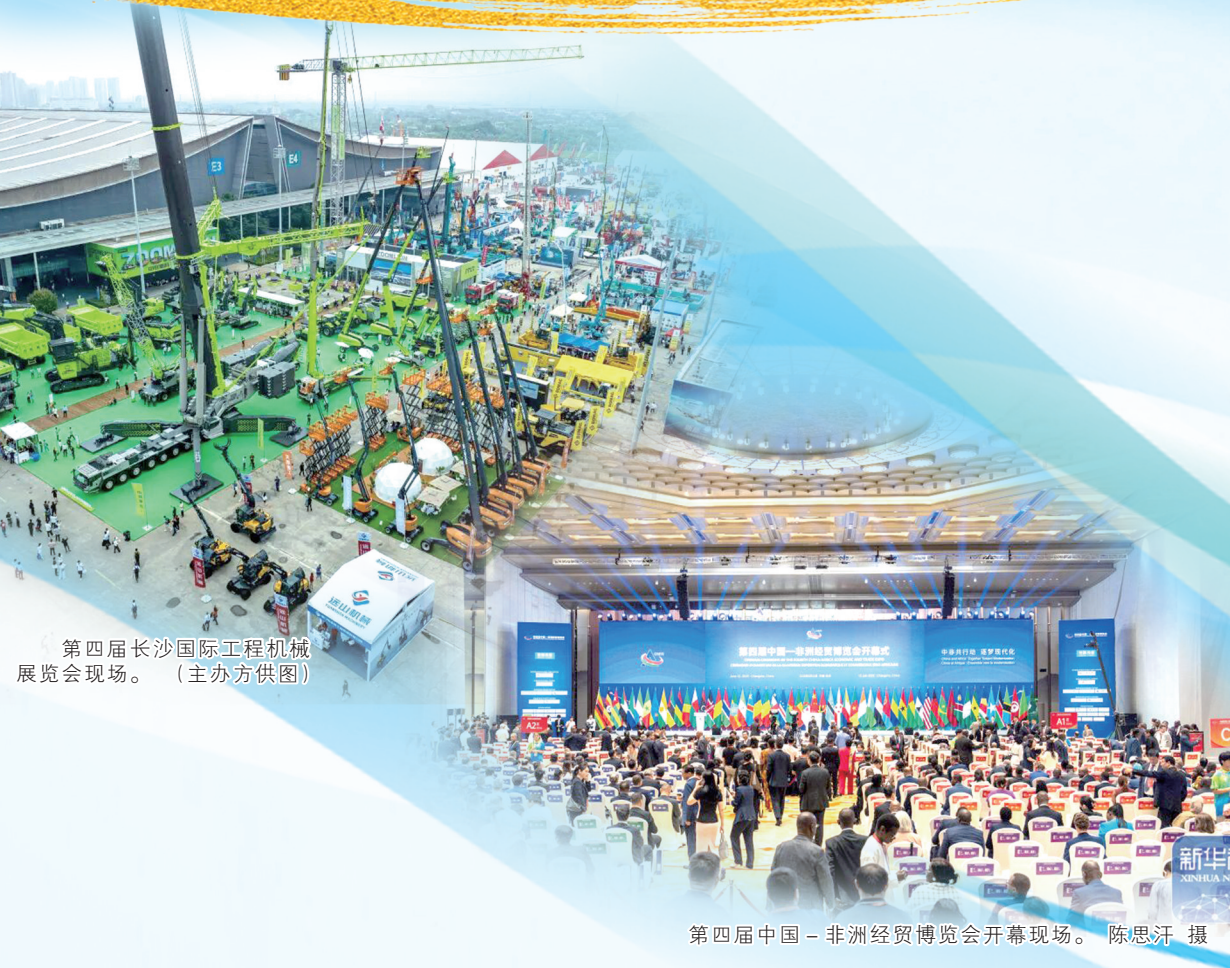
第四届长沙国际工程机械展览会现场。