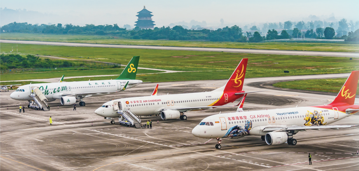
《繁忙的空港》摄于怀化芷江机场。