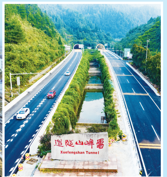
↑《昔日天险今坦途》摄于沪昆高速雪峰山路段。