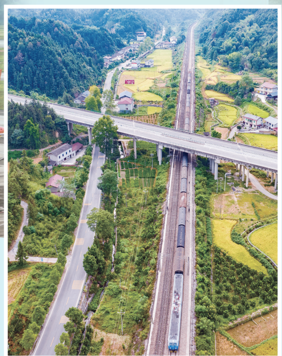
《动脉相连》摄于芷江侗族自治县境内，沪昆高速、320国道与湘黔铁路在此同框。

农村路”示范创建中，溆浦县九溪江至北斗溪、靖州苗族侗族自治县横江桥至坝阳坪等4条公路，也成功入选年度十大“湖南省最美农村路”。 山更美，水更美。在怀化“一江六岸”核心区，溁水河风光带携10座侗族风雨桥、苗族吊脚楼风情馆惊艳面世。以榆树湾码头为起点，以溁水河为轴线，流经榆树湾、天问岛、东盟集三大景区，《福地长歌》溁水夜游项目展开了5.2公里的美轮美奂的长卷。从屈子行吟叩问天地的“福源”，到通道转兵绝境逢生的“福运”；从芷江受降挺立民族脊梁的“福佑”，到杂交水稻哺育人类的“福梦”；从“义利相济”的“洪福洪商”，到国际陆港的“福满五溪、商通天下”……目不暇接的民族文化解读着何谓“福地怀化”。 景更美，路更美。在规划、兴建、养护的同时，怀化市交通运输局还推出了“智能安全屏障”系统。该系统涵盖智能自发光交通标识与车路协同预警两大核心，规模化部署了一系列安全设施，其中包括自发光太阳能地标、护栏警示标识、太阳能圆形柱帽标识、太阳能标志标牌、同步警示灯，配套建设了相应的车路协同预警装置和集镇预警信息指示系统，力求一路顺风。 为开好第五届湖南旅游发展大会，怀化正以其“路况优、桥隧安、设施全、路域美”的公路通行环境，静待八方来客，让每一位游客都能感受到“福地怀化 懂你如家”的城市温度。 从高速服务区到千年古驿道，从智慧旅游服务中心到便民服务站，交通与文旅的深度融合，正在让怀化的每一条路都是风景，每一次出行都是旅游。