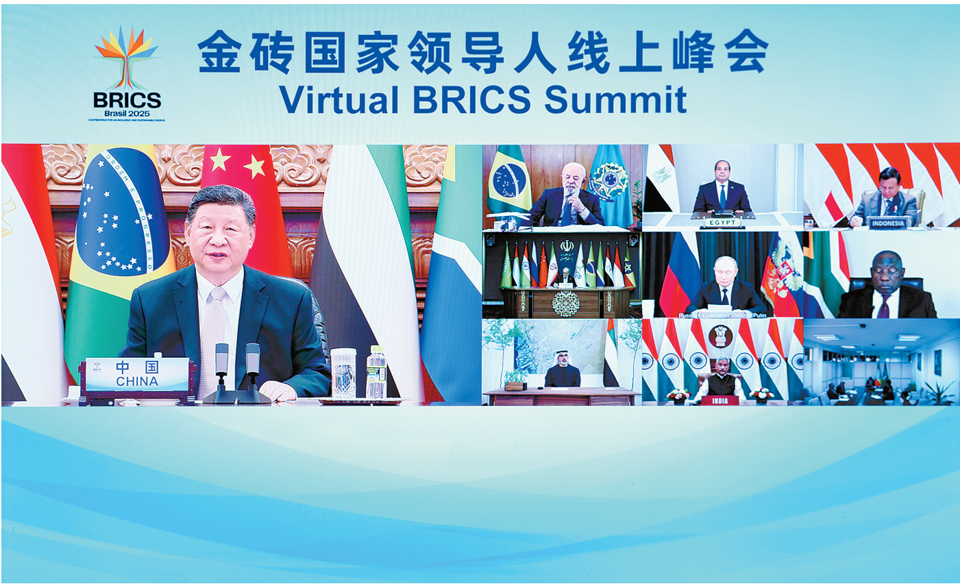
9月8日晚，国家主席习近平出席金砖国家领导人线上峰会，并发表题为《团结合作 砥砺前行》的重要讲话。

新华社北京9月8日电 9月8日晚，国家主席习近平出席金砖国家领导人线上峰会，并发表题为《团结合作 砥砺前行》的重要讲话。