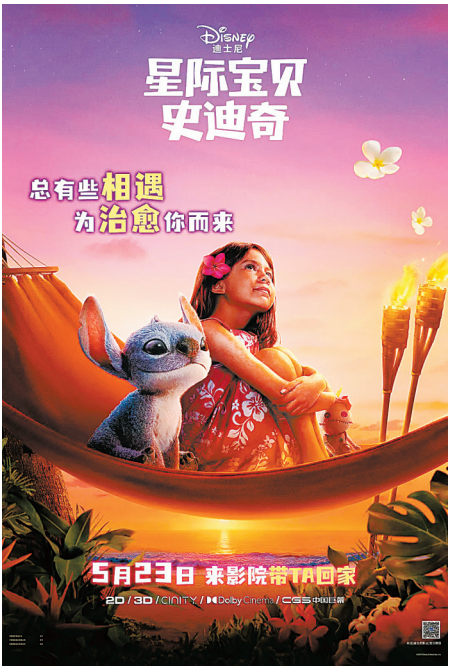
《星际宝贝史迪奇》海报。