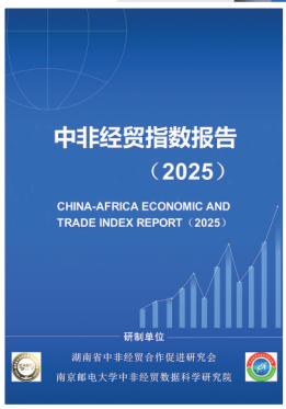
《中非经贸指数报告（2025）》。

制造业从成品出口向本地生产转型，中国企业通过在非洲设立工业园区和生产基地，就地生产纺织、电子、建筑材料等产品，不仅有效降低了物流成本，更能精准满足区域市场需求；此外，数字经济与技术服务新兴行业崛起，贸易形式从单一传统交易向跨境电商转变，为非洲地区的互联网覆盖率提升作出了贡献，更让中非贸易突破时空限制。这两项成果的发布，不仅是对过往合作的总结，更是对未来的科学认知。它们为政府决策提供了“望远镜”和“显微镜”，为企业投资装上了“导航仪”和“避险盾”，标志着中非经贸合作从“感性认知”向“理性分析”跨越。