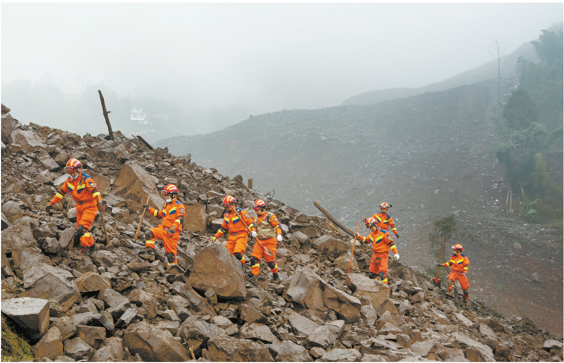
2月9日，消防战士在搜救被困人员。

灾害发生后，四川省启动地质灾害一级应急响应、自然灾害救助三级响应，省委省政府主要负责同志第一时间