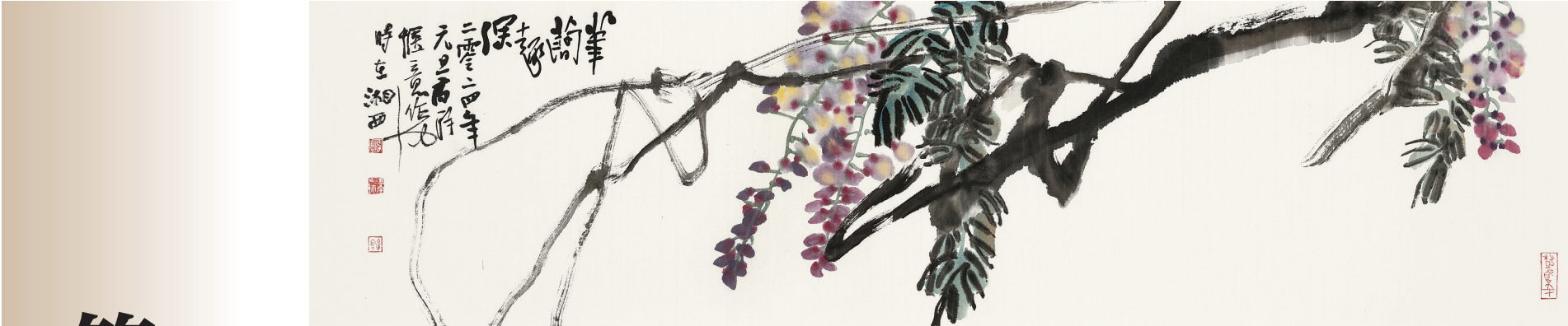
《简笔紫藤》34.5cmX137cm 2024年 纸本设色

苏高宇作画取法高古，笔墨求新，立意超拔，品格雅正。他落笔之时，腕底有沉雄古意，心间有时代风日。