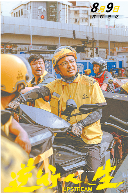
电影《逆行人生》海报。

徐峥导演并主演的新作《逆行人生》8月9日登录院线，让紧密贴近群众生活的外卖员出现在大银幕，为2024年暑期档增添了一抹“亮黄”的温暖底色。