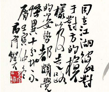
《江湖》14.5cm × 68.5cm 2022年 纸本水墨

苏高宇的绘画实践既是对中国绘画艺术优秀美学传统的继承，又为当代中国绘画艺术创新发展提供了有效的探索路径，体现着对当代中国人精神品格的探求和赞美，其绘画艺术可以视为作为当代中国人的灵魂和精神塑型写照，着意勾画和渲染出蓬勃向上的新时代气象。