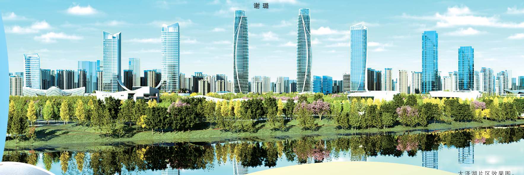
大泽湖片区效果图。