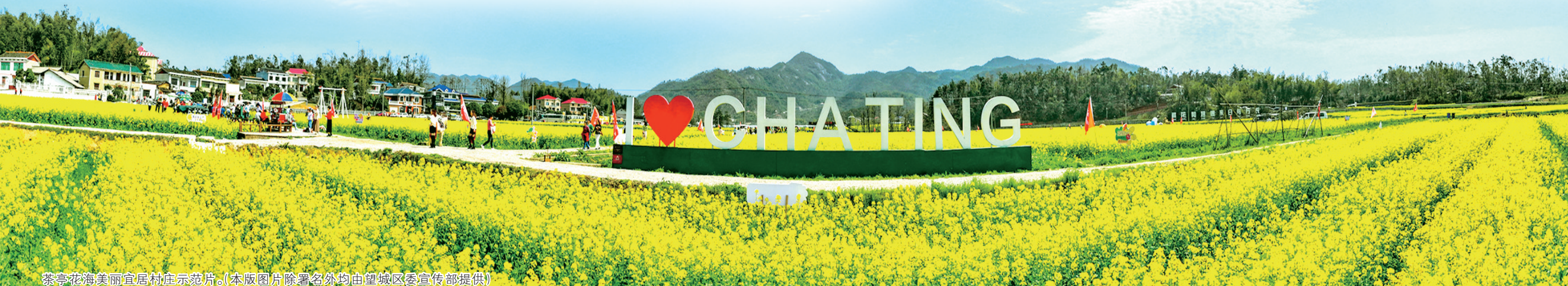
茶亭花海美丽宜居村庄示范片。

湘水流日夜,慷慨歌未央。新时代新征程上,望城区将以改革为舵、以创新为帆、以实干为桨,向着更加开阔的潮头破浪前行!