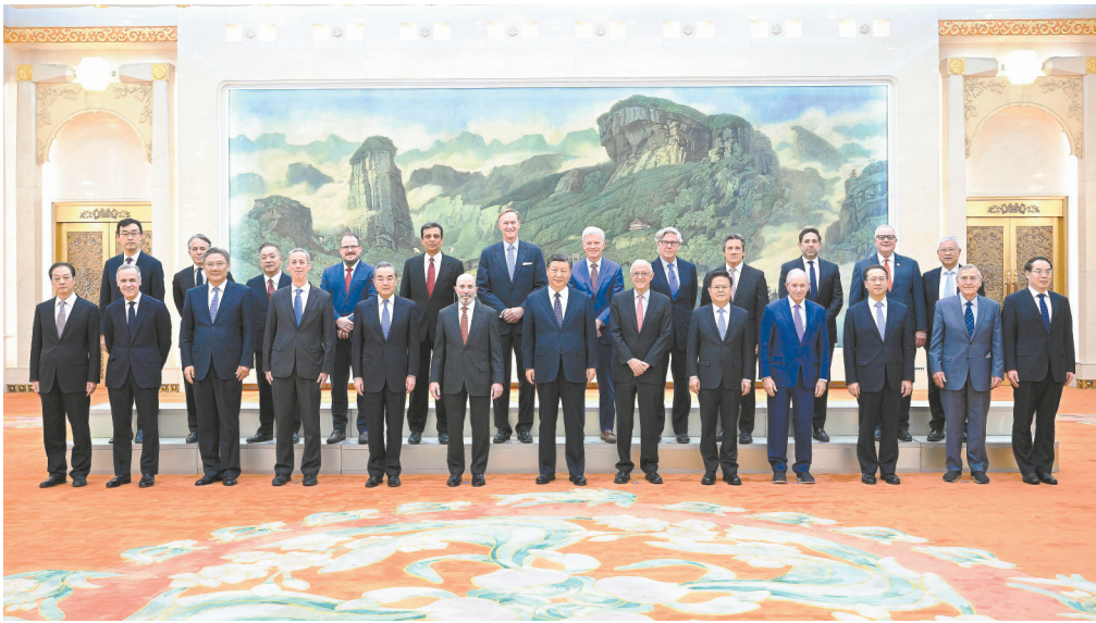
3月27日,国家主席习近平在北京人民大会堂集体会见美国工商界和战略学术界代表。

新华社北京3月27日电 3月27日,国家主席习近平在北京人民大会堂集体会见美国工商界和战略学术界代表。 习近平对美国工商界和战略学术界人士在春暖花开之际访华表示欢迎。习近平指出,中美关系是世界上最重要的双边关系之一。中美两国是合作还是对抗,事关两国人民福祉和人类前途命运。中美各自的成功是彼此的机遇。只要双方都把对方视为伙伴,相互尊重、和平共处、合作共赢,中美关系就会好起来。今年是中美建交45周年。中美关系史是