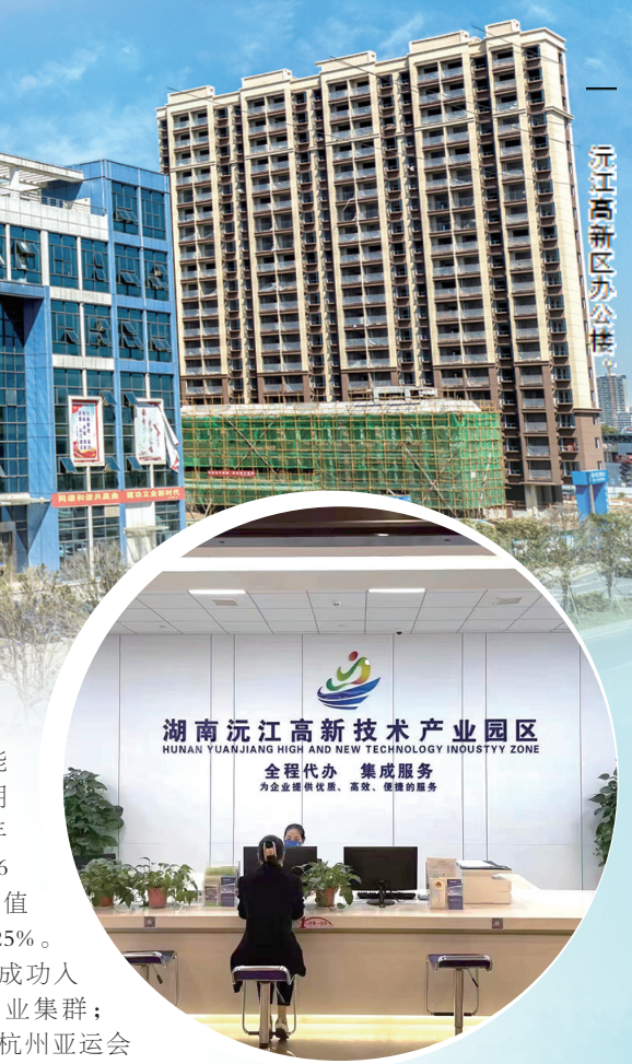
沅江高新区办公共楼。

营商环境是企业生存发展的土壤,好的营商环境就是生产力、竞争力。1月19日,湖南高院联合省委政法委、省发改委、省工信厅、省工商联召开优化营商环境服务经济高质量发展新闻发布会并公布9个典型案例。其中,沅江市人民法院报送的《湖南某船舶公司诉大理市某港务管理站船舶建造合同纠纷案》获评“2023年度优化营商环境典型案例”。 2023年,沅江高新区“三环”联结,不断优化营商环境,激活企业发展潜力。 提速行政审批环节。深化“四即改革”(洽谈即服务、签约即供地、开工即配套、竣工即办证),完善区域评审,承接经济管理审批权限172项,设立“一件事一次办”综合服务专区,实施“一站