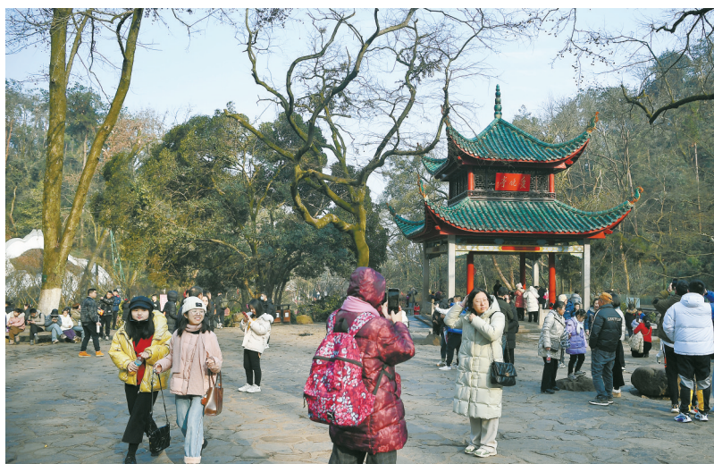
2月9日,长沙雪过天晴,游客在岳麓山景区游玩。当天,该景区有序恢复对外开放。

设翰硕科技水工仪器设备生产项目。 不少市州聘请在外湘商作为招商大使。4日,衡阳市蒸湘区举行新春“湘商回归”和返乡创业主题活动,为7名招商大使颁发聘书。6日,株洲市举行2024年回乡企业家新春交流会,为2023年度优秀招商顾问颁发奖牌,并为一批2024年招商顾问颁发聘书。岳阳市君山区在春节前夕表彰首届“最美乡贤”和“杰出君商”。据了解,近年来君山区通过乡友招商等形式,共引进乡友投资项目20个。 一批重点项目正在谋划。宁乡市2024年重大在联在谈项目24个,一季度拟签约项目约14个,其中海信电器生产基地项目总投资100亿元。5日,岳阳市平江县对外发布81个招商项目信息,涵盖物流、商贸、地产、休闲、现代服务业等多个投资领域。