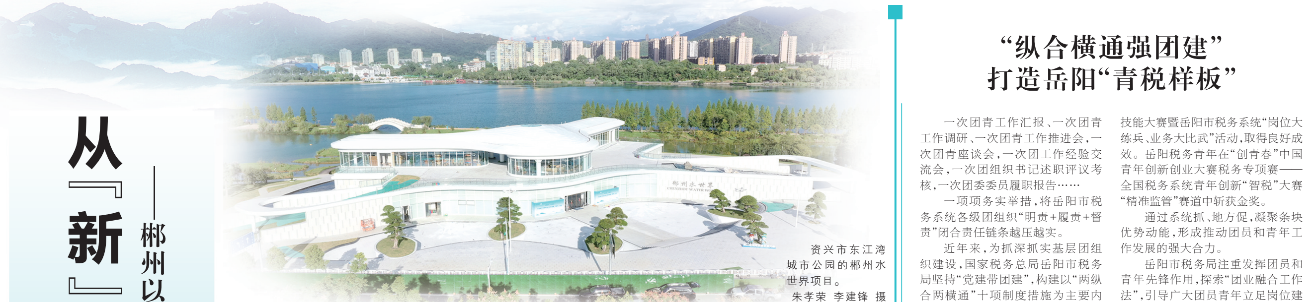
资兴市东江湾城市公园的郴州水世界项目。