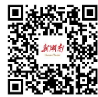
全文请扫湖南二码

“真相的探寻从来不会唾手可得。随着国家公祭日设立，越来越多人帮助南京还原史实拼图。”南京市委宣传部副部长、侵华日军南京大屠杀遇难同胞纪念馆馆长周峰说，截至目前，纪念馆各类藏品总量已达19.3万件(套)。(据新华社南京12月12日电)