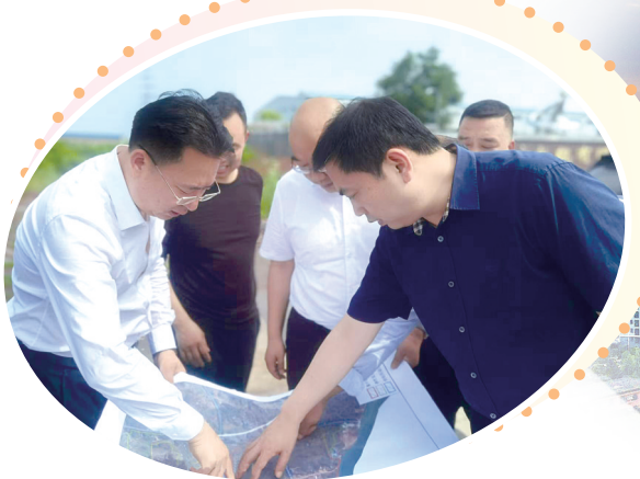
祁东县主要领导在讨论发展规划。