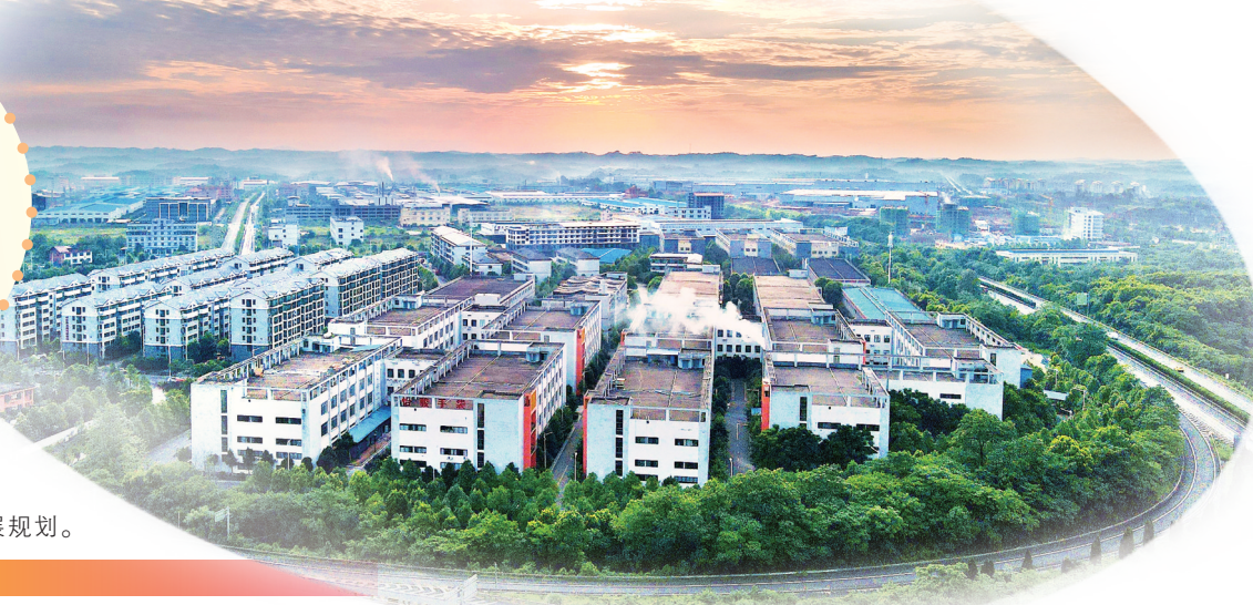
祁东工业园区一角。