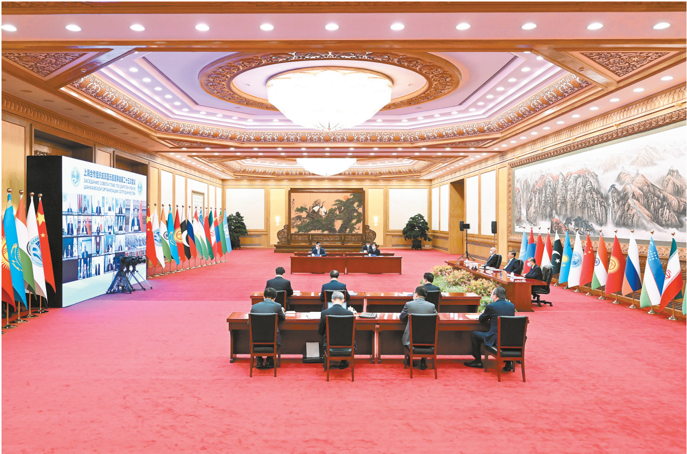
7月4日下午，国家主席习近平在北京以视频方式出席上海合作组织成员国元首理事会第二十三次会议并发表题为《牢记初心使命 坚持团结协作 实现更大发展》的重要讲话。