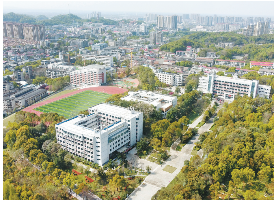
益阳师范高等专科学校。