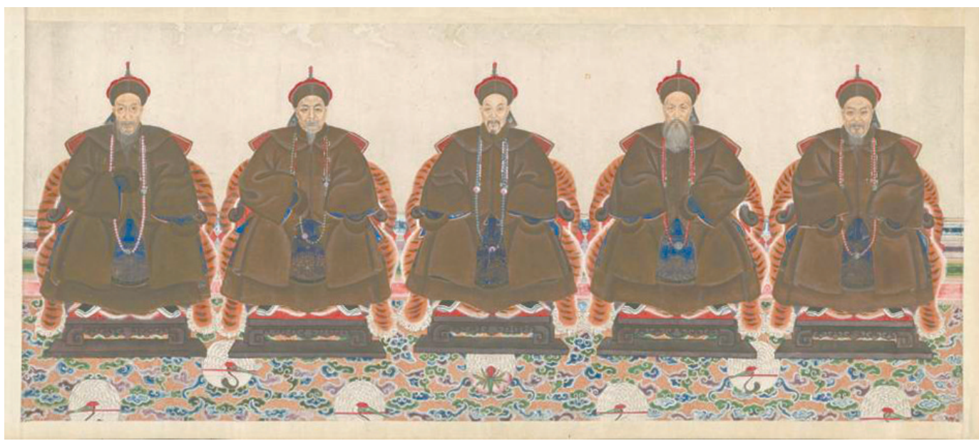
彭玉麟、左宗棠、胡林翼、曾国藩、杨岳斌(从左至右)画像。(湖南博物院藏)

中华民族历史上产生过许多卓越优秀的人物,中华文化一直在推崇追随这样的人物,而这种人是极少数,历史上我们把他们叫作“圣贤”。儒家文化从一开始就提出克己复礼,修己安人,“修齐治平”。宋朝之前,儒家思想停留在道德层面,常常收拾不住人心,社会公认的“圣贤”凤毛麟角。直到周敦颐提出太极说,把人一类看作是宇宙生生不息产物,人的“中正仁义”来自于“天道”。从此,儒学豁然开朗,走向复兴。周敦颐复兴儒学最重要途径就是为理学找到了形而上的理论。如果说原始儒学强调的是道德践行,那么理学哲学强调的是形而上的信仰,也就是我们所说的天地境界。道德可以遵守,但是难以信仰,宗教和哲学则是信仰的源泉。精英治国,精英如果没有信仰,没有天地境界,国家民族如何得了?内圣才能外王,有信仰方可治国安邦,周敦颐成为理学宗主仅仅因此。