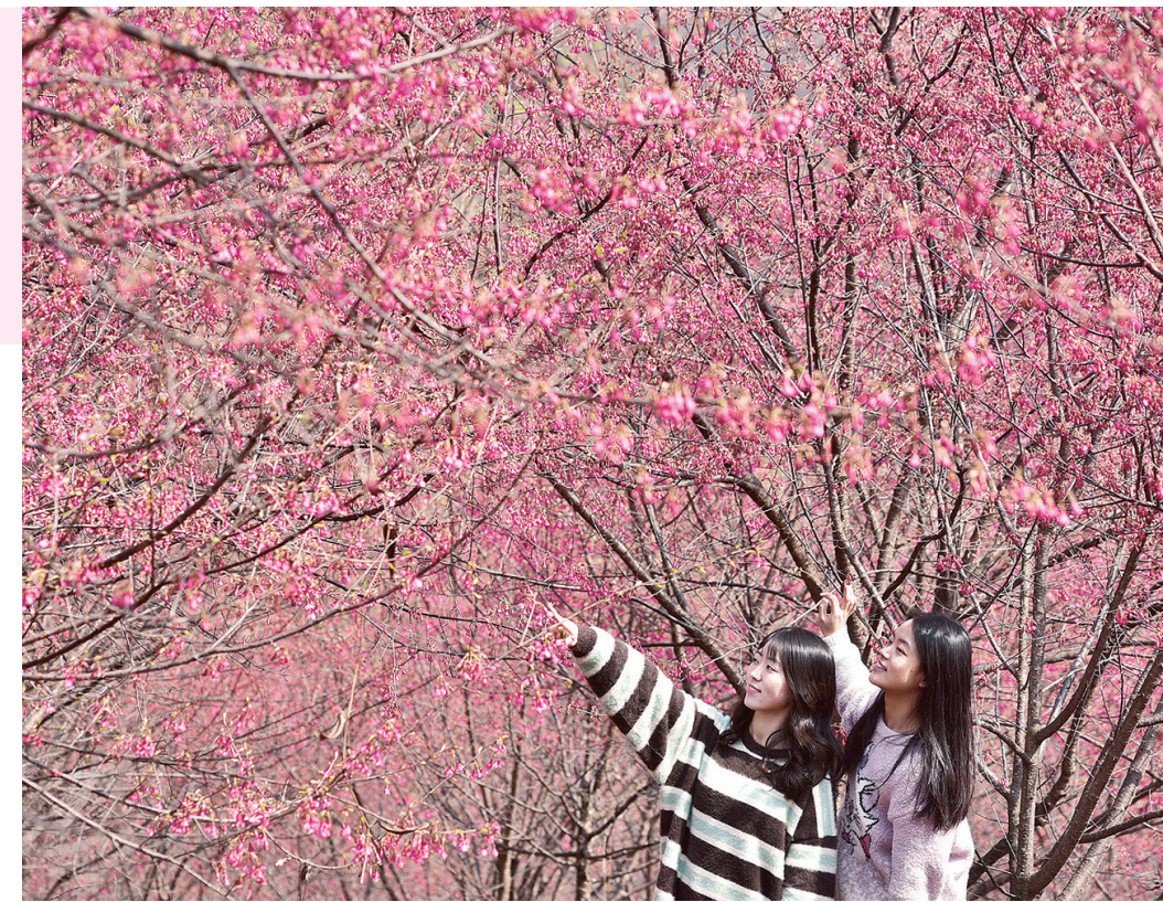
稳增长 促发展 强信心