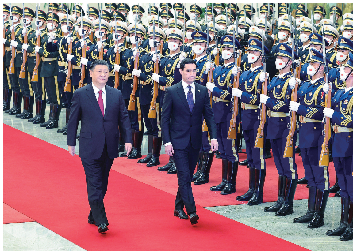
一月六日，国家主席习近平在北京人民大会堂同土库曼斯坦总统谢尔达尔·别尔德穆哈梅多夫举行会谈。这是会谈前，习近平在人民大会堂同土库曼斯坦总统谢尔达尔·别尔德穆哈梅多夫举行会谈。