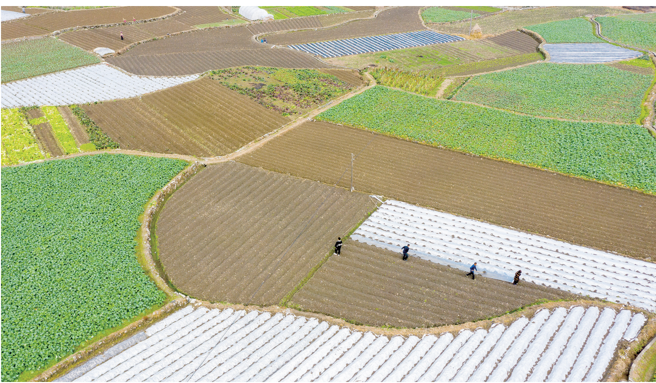
1月3日,吉首市乾州街道西门口村,村民给田间的马铃薯覆盖地膜,确保增产增收。