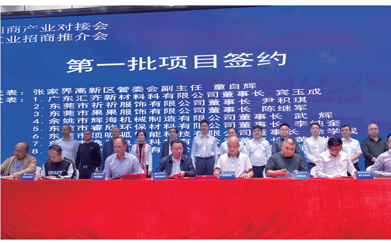
第六次东莞湘商产业资源对接会现场。

在硬件方面，张家界全面完成市、区（县）两级电子商务服务中心和全市1016个村（居）村级电商综合服务站建设，“一园区四中心”和“县有中心村有站”的电子商务服务体系基本建成。