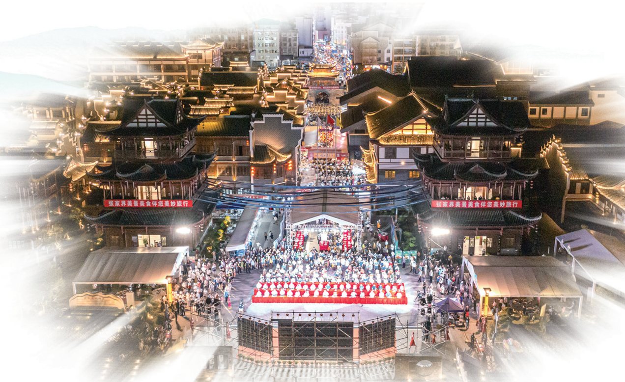
第三届张家界旅游美食节盛况。

在软件方面，张家界创新电商新模式，利用直播营销、社交电商等新业态，开展网上年货节、抖音直播带货、电子商务交易博览会等活动，持续打造“千年庸农”“晒有慈利”“源来桑植”“武陵源生”四大区域公共品牌，逐步形成了以莓茶、葛根等本地农特优产品为代表的网销品牌，2021年10月至今全市电商销售农产品金额8.96亿元。 消费、物流、电子商务的全方位进步，补齐了产业链条上的各个短板，搅动旅游市场“一池春水”，也加速张家界这座旅游城市迭代进步的步伐。