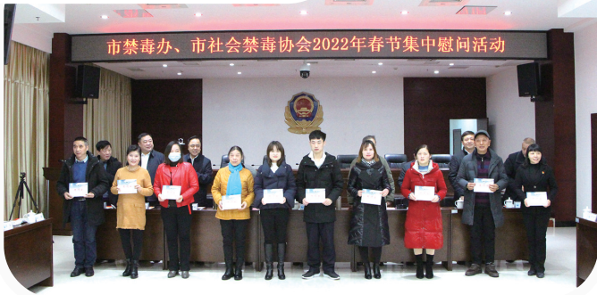
→ 2022年春节,长沙市禁毒办、市社会禁毒协会举行集中慰问活动。