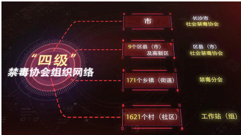
长沙市社会禁毒协会四级组织网络图。