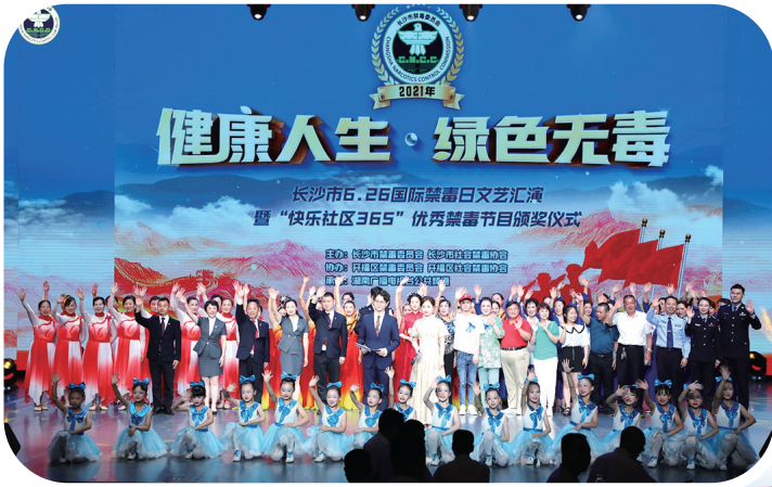
← 2021年,长沙市禁毒委、市社会禁毒协会举行“6·26”国际禁毒日文艺汇演暨“快乐社区365”优秀禁毒节目颁奖仪式。