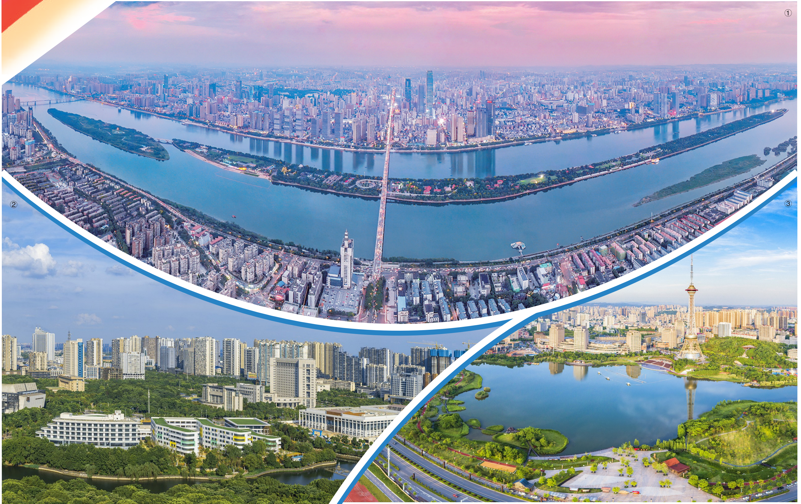
推动长株潭都市圈一体化发展，带动湖南省各市州融入中部地区高质量发展大战略。图为长株潭都市圈三个核心城市——长沙(图①)、湘潭(图②)、株洲(图③)。