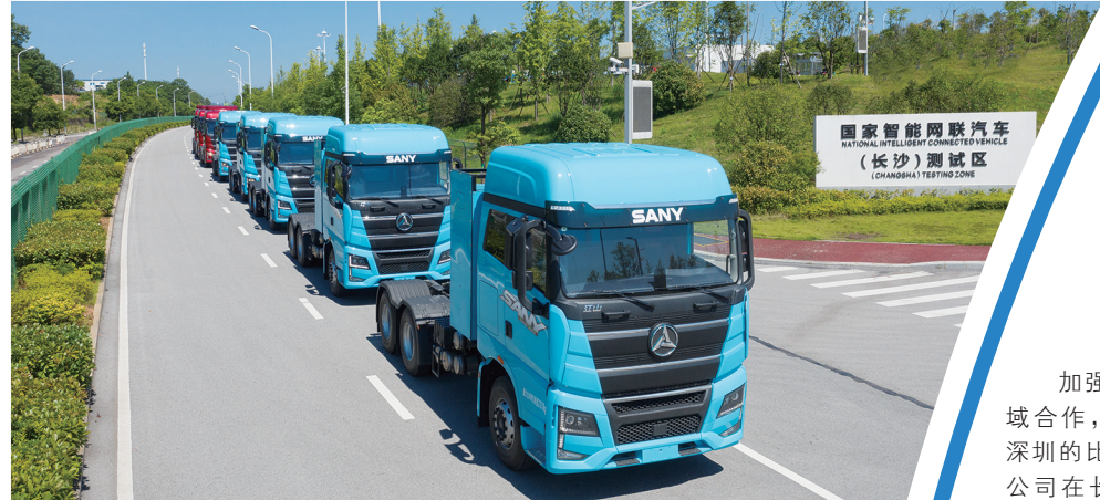
湖南湘江新区作为中部地区重要国家级新区，着力推进智能网联汽车产业链建设。图为三一重工5G智慧重卡在湖南湘江新区智能系统测试区进行测试。

湖南省发挥东部沿海地区和中西部地区过渡带、长江开放经济带和沿海开放经济带结合部的区位优势，抓住产业梯度转移和国家支持中西部地区发展的重大机遇，加快形成结构合理、方式优化、区域协调、城乡一体的发展新格局。