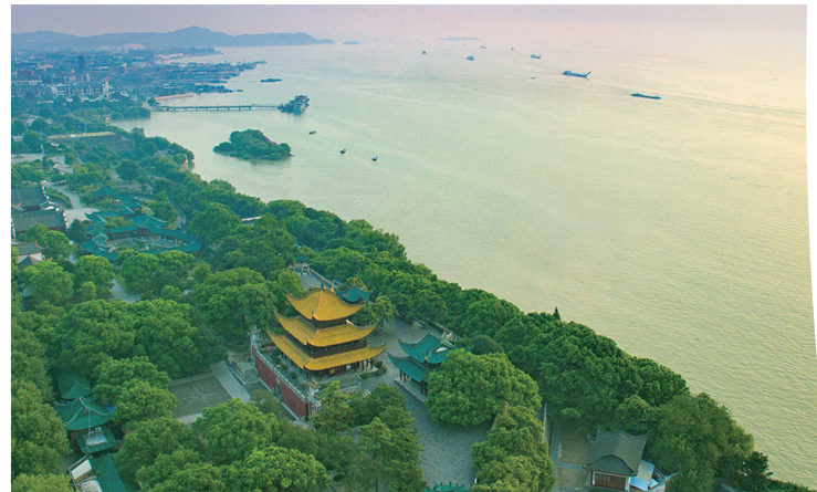
全面融入国家长江经济带发展战略，积极建设长江开放经济带绿色发展示范区。图为岳阳市岳阳楼区。