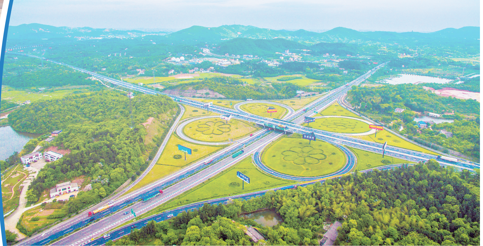
高速公路“七纵七横”基本成网，通车里程位居全国前列，实现“县县通高速”。图为湘潭市岳塘区殷家坳交通枢纽。