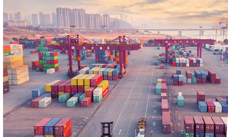
构建以“一江一湖四水”为骨干的航道网及“一枢纽多重点广延伸”的全省港口体系。图为长沙新港码头。

大力建设“一枢纽一干线九支线”民航运输网，以长沙黄花国际机场为中心，联动张家界旅游干线机场和省内其他支线机场，开通国内国际客货运航线380余条。图为长沙黄花国际机场。