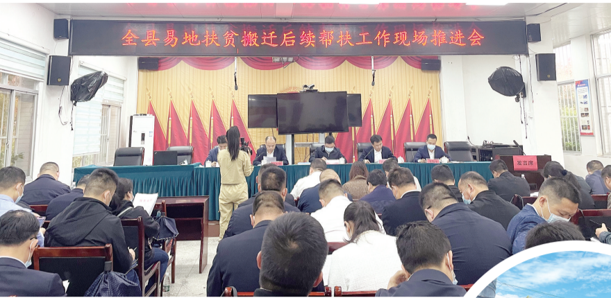
▲全县易地扶贫搬迁后续帮扶工作现场推进会。

►溆浦县小横垅乡白水安置小区罗汉果产业帮扶基地。