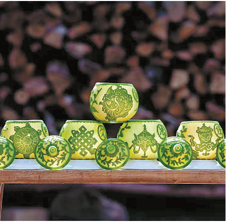
雕花蜜饯《苗侗风情》。

雕制蜜饯是靖州农家妇女每年夏天生活的一部分,表达的是对美好生活的赞美和向往。两位非遗传承人说,蜜饯雕了一辈子,没想到会获得政府和专家那么高的评价,给她们的手艺活儿戴上了一顶国家级非物质文化遗产的桂冠,并且每年还给她们奖励。她们很开心,在一群半大孩子的簇拥下,难得越发用心了,几个小姑娘也手里捏把柳叶刀学得有模有样。