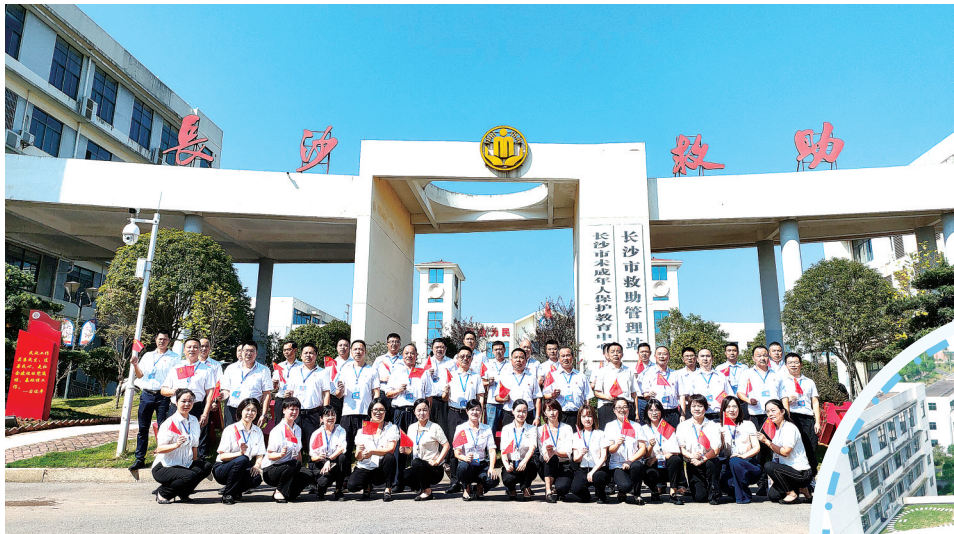
▲2021年,长沙市救助站庆祝建党一百周年全体人员合影。