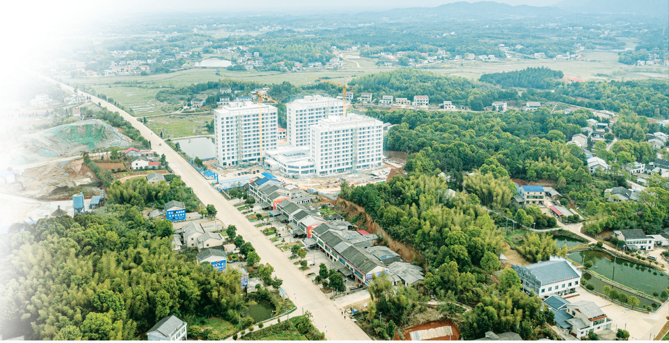
正在建设中的康尔乐文旅康养基地。