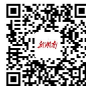
文件全文请扫新湖南二维码

加强党员队伍建设，使基层党组织成为学校教书育人的坚强战斗堡垒。要把思想政治工作紧紧抓在手上，深入开展社会主义核心价值观教育，抓好学生德育工作，把弘扬革命传统、传承红色基因深刻融入学校教育，厚植爱党、爱国、爱人民、爱社会主义的情感，努力培养德智体美劳全面发展的社会主义建设者和接班人。要加强分类指导、分步实施，针对不同类型、不同规模的学校，在做好思想准备、组织准备、工作准备的前提下，成熟一个调整一个，推动改革落到实处。贯彻落实中的重要事项，要及时向党请示报告。