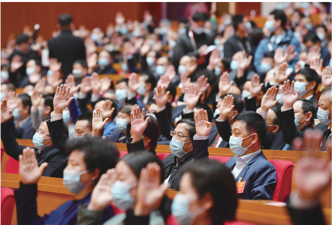
1月19日，在省政协十二届五次会议闭幕会上，委员们举手表决。