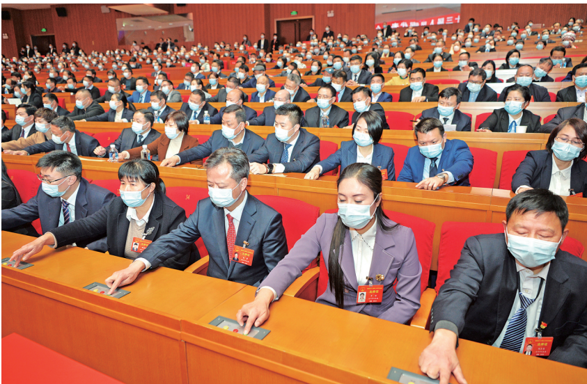
1月19日，省十三届人大五次会议第三次全体会议上，代表们按键表决。