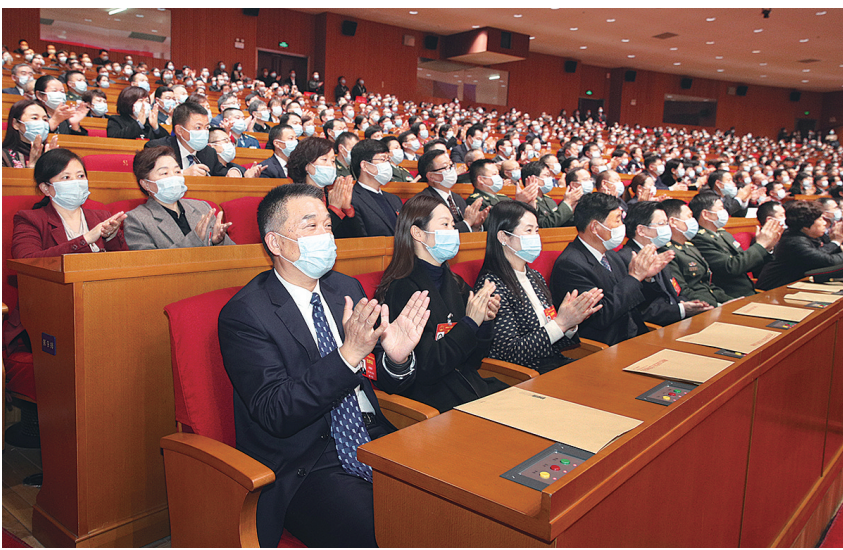
1月19日，省十三届人大五次会议第三次全体会议上，代表们热烈鼓掌。