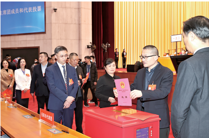
1月19日，省十三届人大五次会议第三次全体会议上，代表们投出神圣的一票。