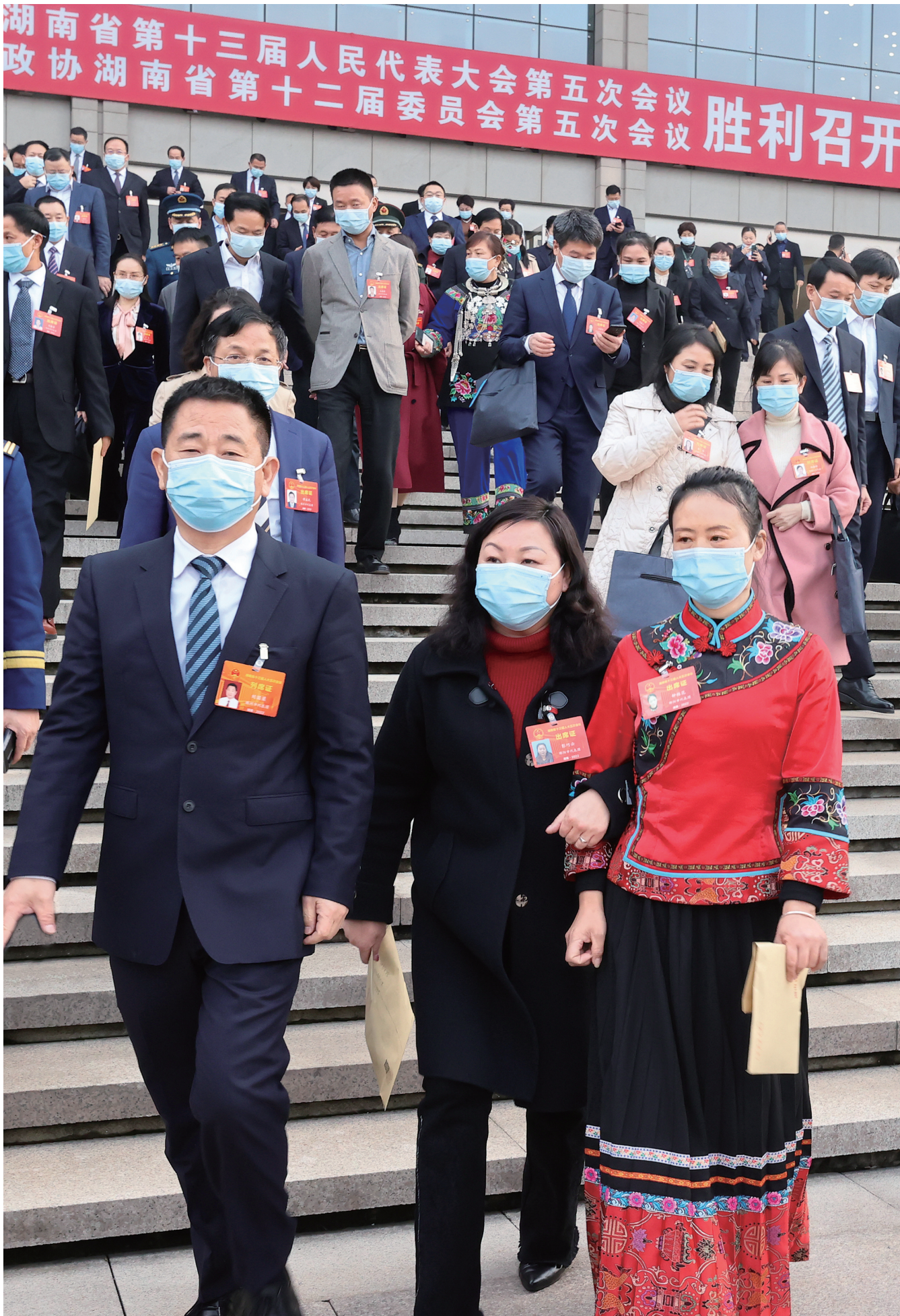
1月19日，省十三届人大五次会议闭幕，代表们信心满怀走出会场。